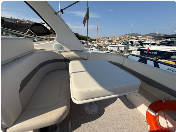
CHAPARRAL SIGNATURE 310 Dinette detail