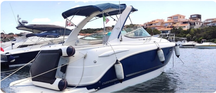
CHAPARRAL SIGNATURE 310 Aft Profile