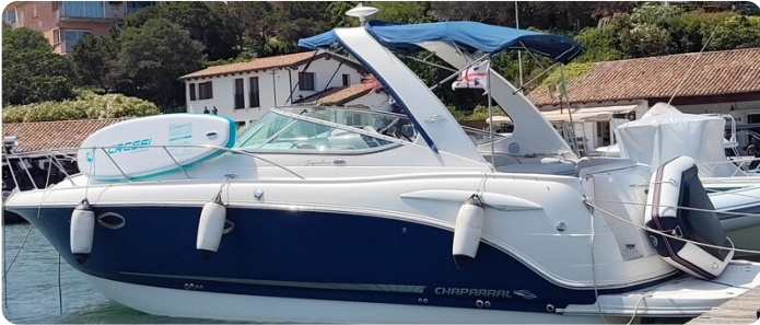
CHAPARRAL SIGNATURE 310 Profile