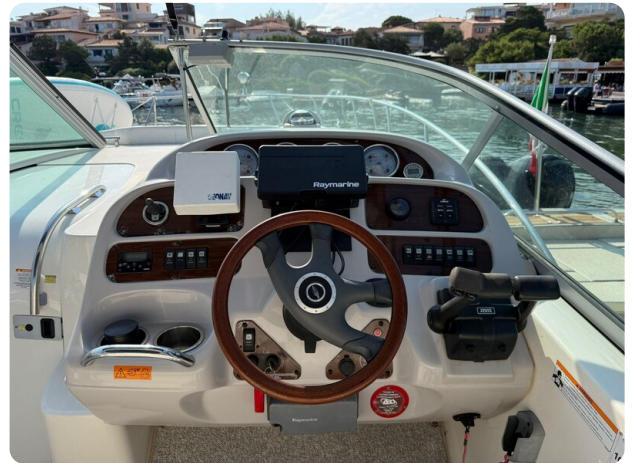
CHAPARRAL SIGNATURE 310 Helm console