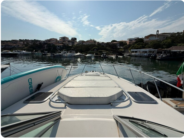
CHAPARRAL SIGNATURE 310 Bow sunbed