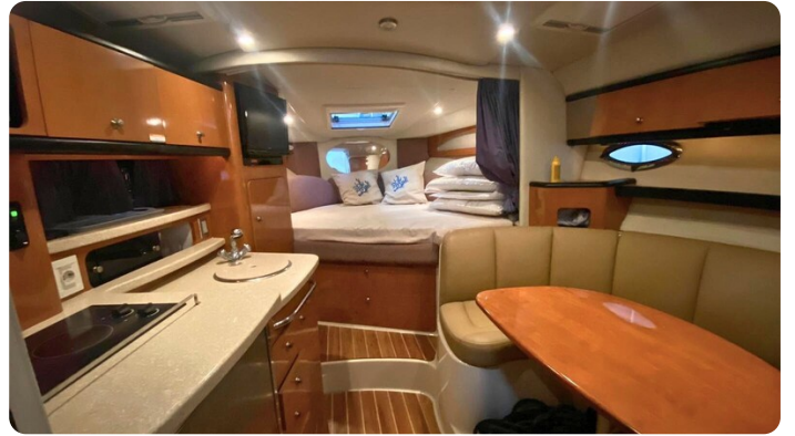
CHAPARRAL SIGNATURE 310 Cabin