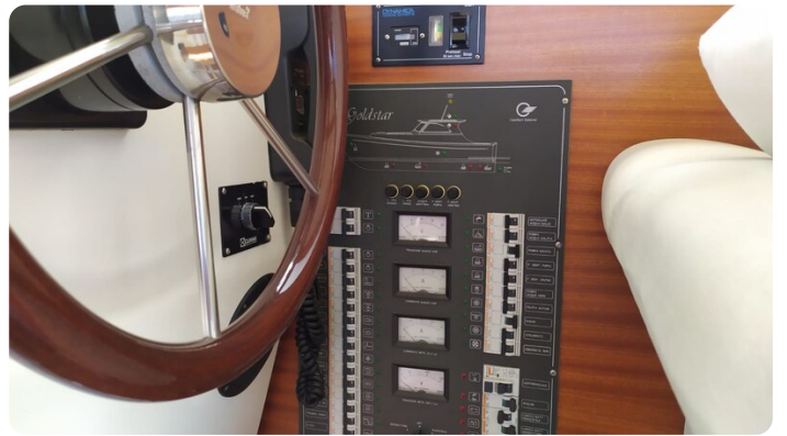
Goldstar 360 dettaglio