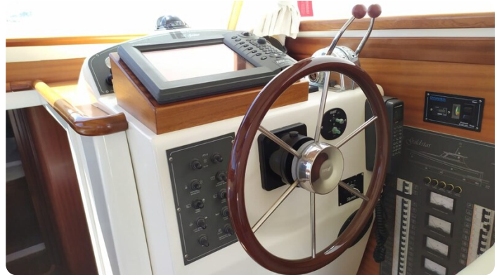
Goldstar 360 piloteria