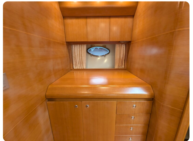
Sarnico Spider galley, closed