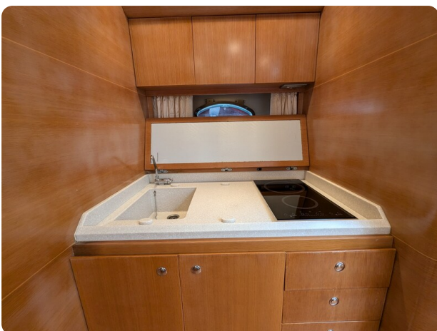
Sarnico Spider galley