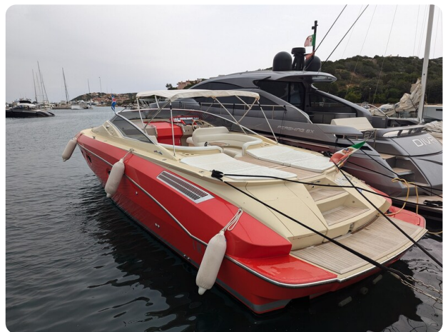
Sarnico Spider aft profile