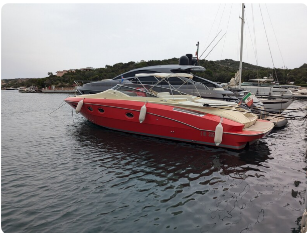
Sarnico Spider, profile