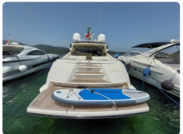
Sarnico 60 RiAl aft view