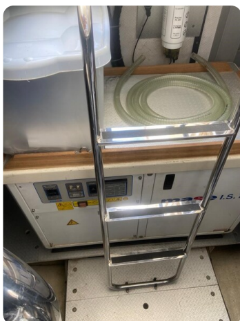
Sarnico 60, engine room