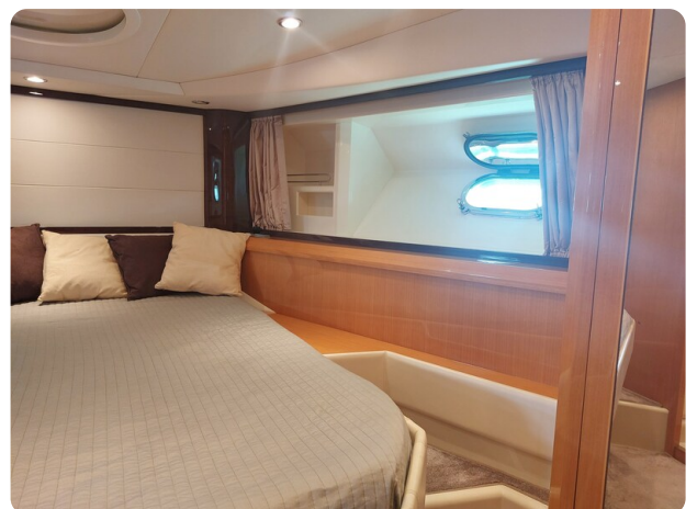
Sarnico 60 RiAl pics 141636