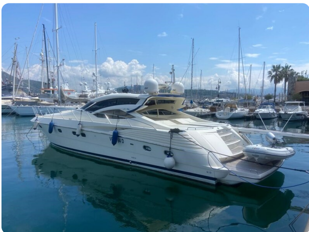
Sarnico 60 profile