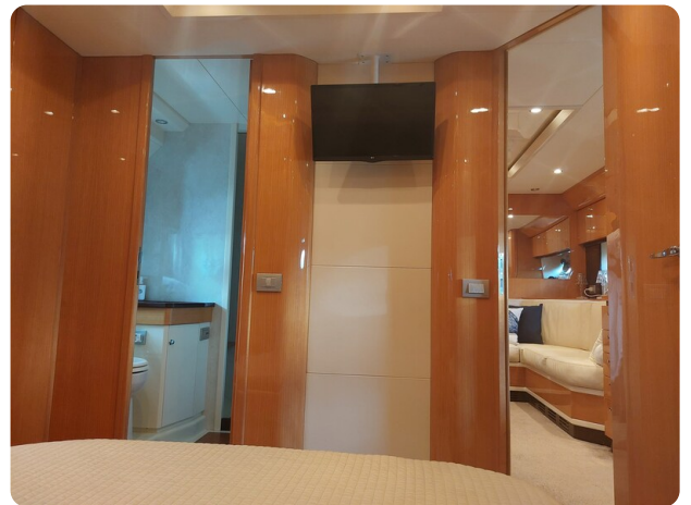
Sarnico 60 RiAl master cabin and toilette