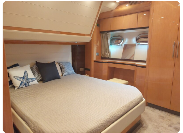
Sarnico 60 RiAl master cabin