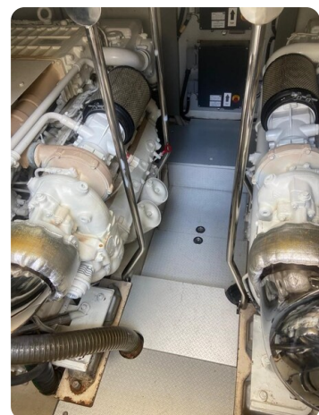
Sarnico 60 engine