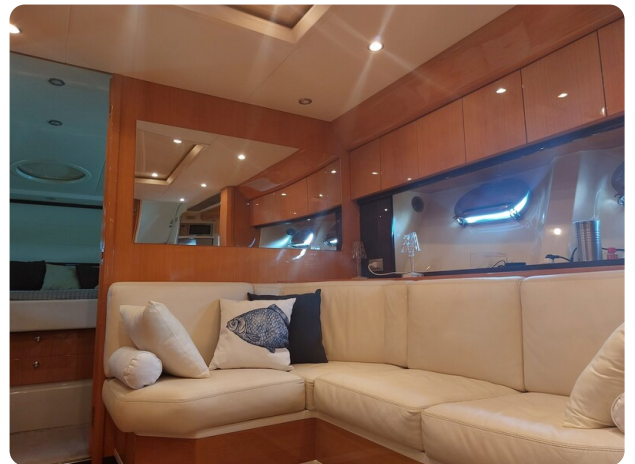
Sarnico 60 RiAl interior salon (1)