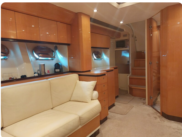
Sarnico 60 RiAl dinette and galley