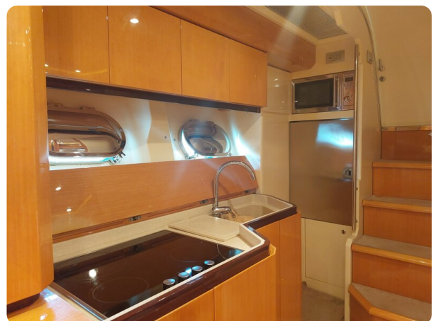
Sarnico 60 RiAl interior galley