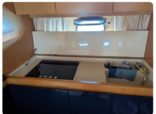
Sarnico 58 galley