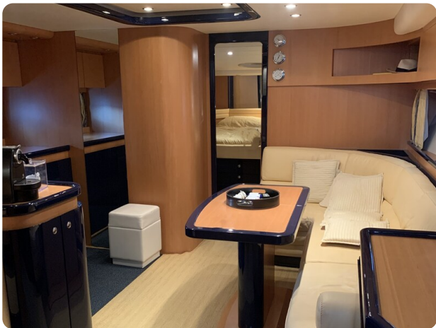
Sarnico 58 salon