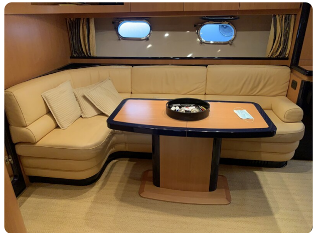
Sarnico 58 salon dinette