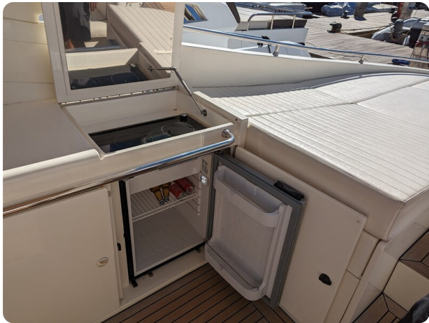
Sarnico 58 cockpit galley