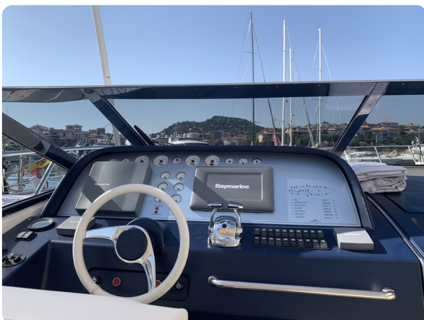
Sarnico 58 helm