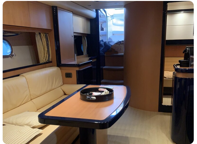
Sarnico 58 salon