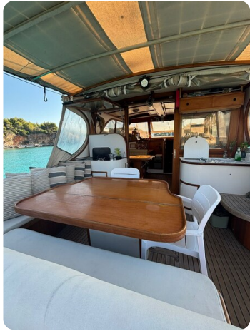
Cockpit dining area 2