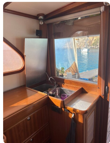
Galley sink inside 2.JPG