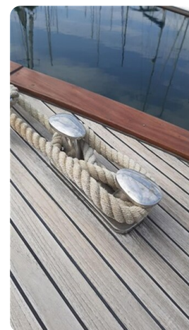
Bow cleat detail