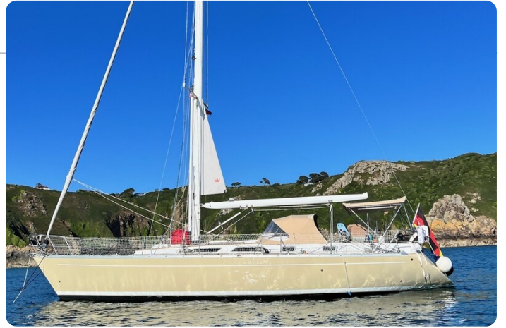
Grand Soleil 45 1