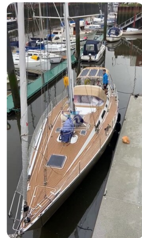
Grand Soleil 45 70