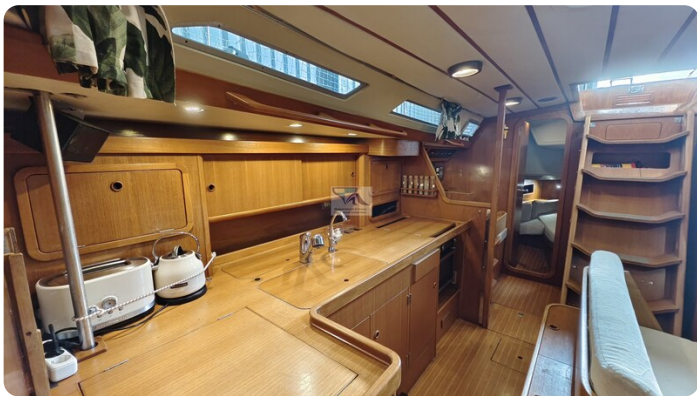
Grand Soleil 45 99