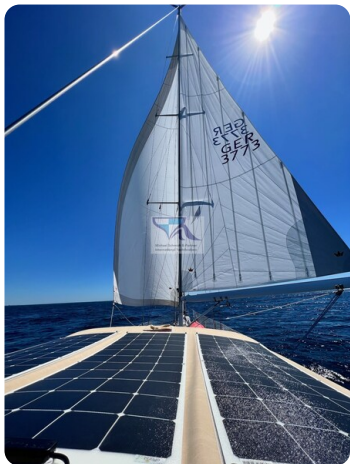
Grand Soleil 45 88