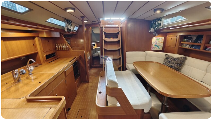
Grand Soleil 45 97