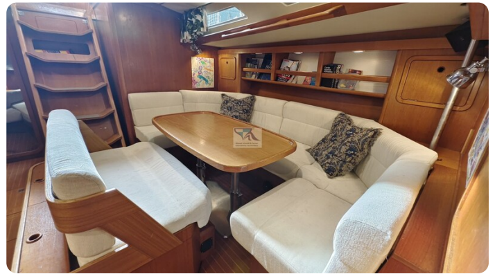
Grand Soleil 45 98