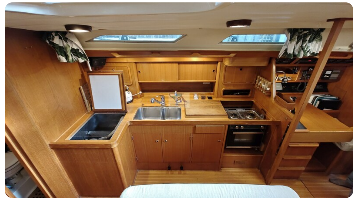
Grand Soleil 45 101