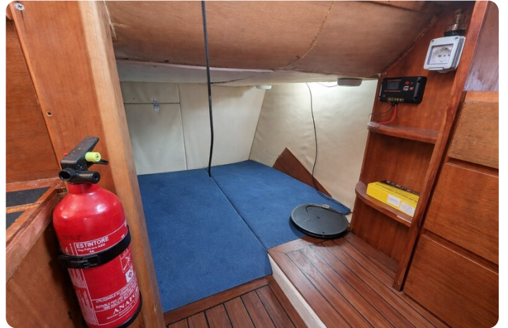
Canamer 33 aft cabin