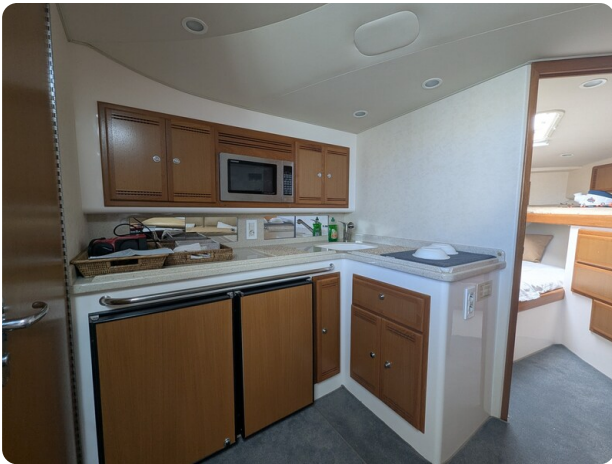
Cabo 38 Express galley