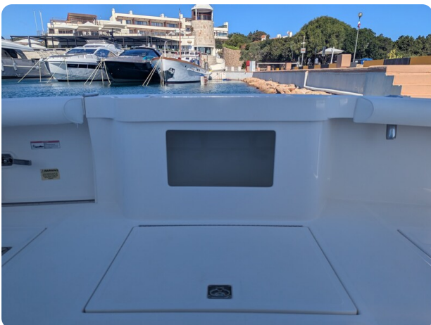
Cabo 38 Express live baitwell