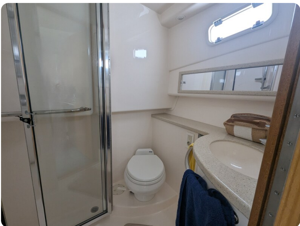
Cabo 38 Express bathroom