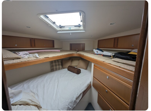
Cabo 38 Express cabin