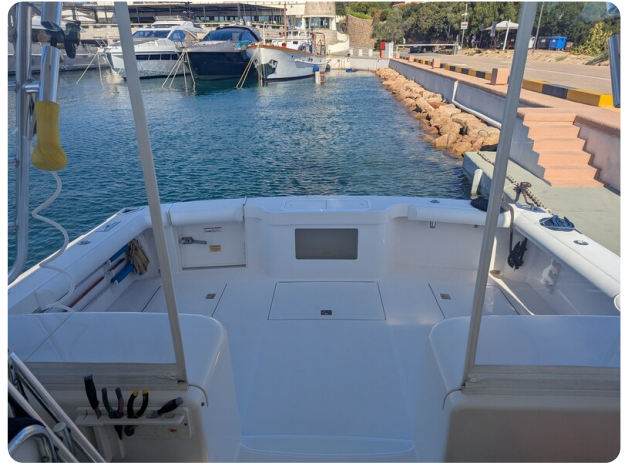
Cabo 38 Express cockpit view