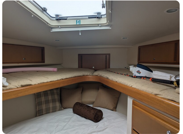
Cabo 38 Express cabin detail