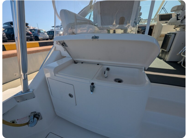
Cabo 38 Express cockpit sink