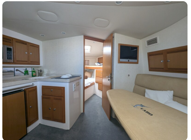
Cabo 38 Express interiors