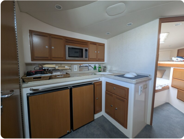
Cabo 38 Express galley