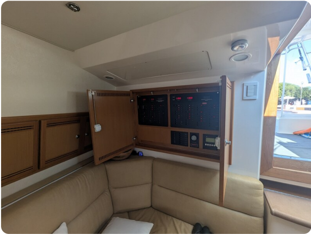
Cabo 38 Express salon detail