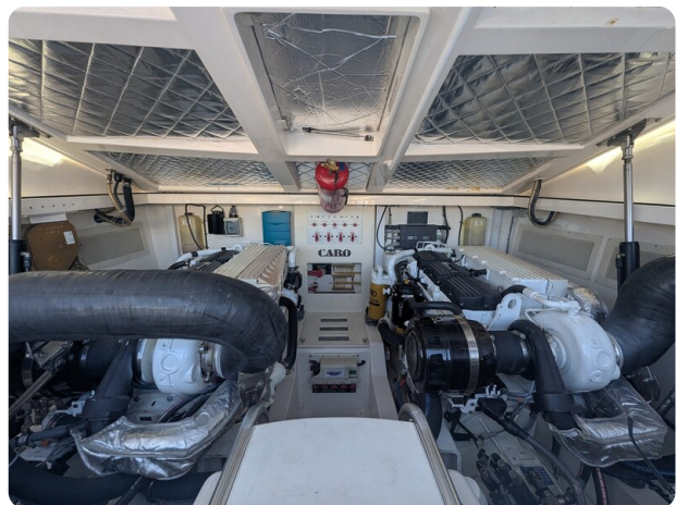
Cabo 38 Express engine room