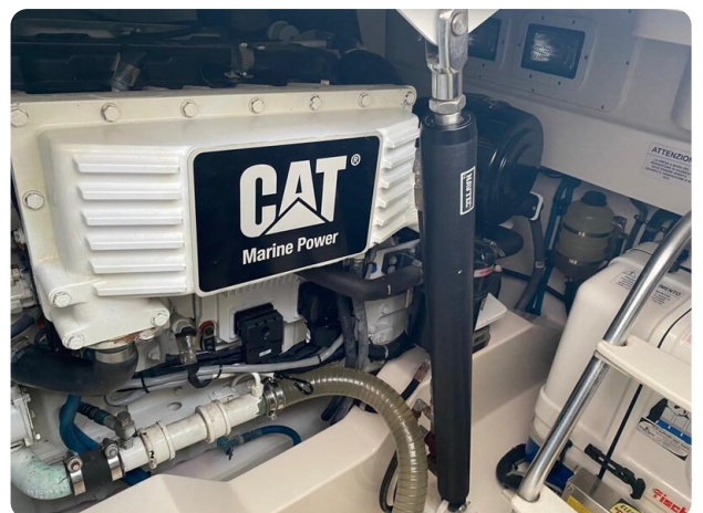
Cabo 36 Express engine detail