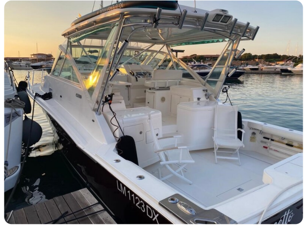
Cabo 36 Express aft profile