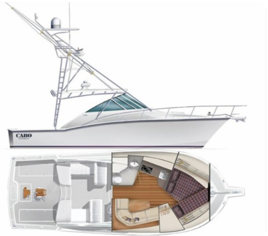
Cabo 36 Express layout