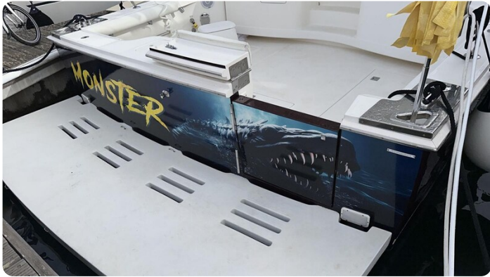
Cabo 36 Express transom detail