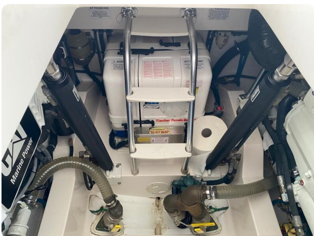
Cabo 36 Express engine room