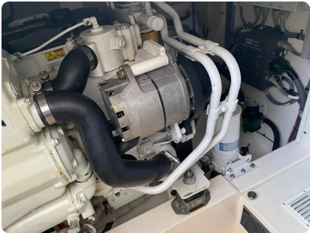
Cabo 36 Express engine room detail