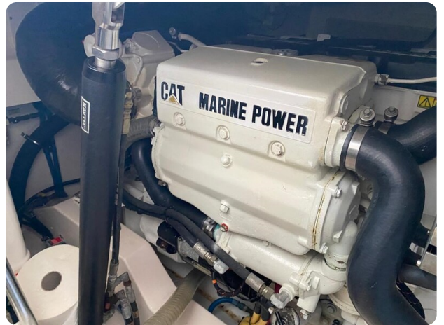
Cabo 36 Express engine