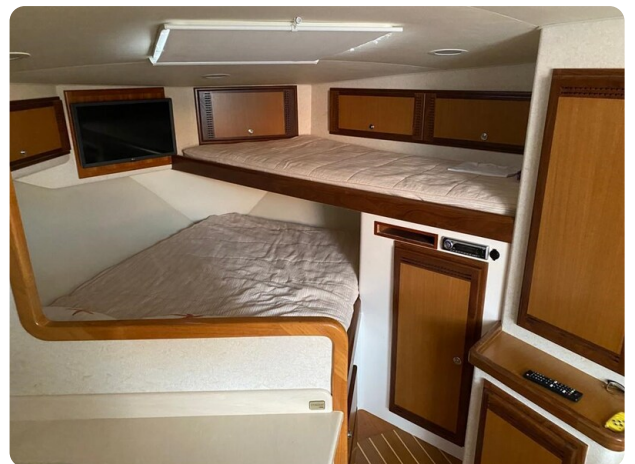
Cabo 36 Express cabin