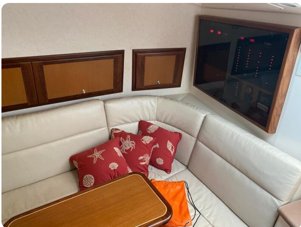
Cabo 36 Express cabin dinette