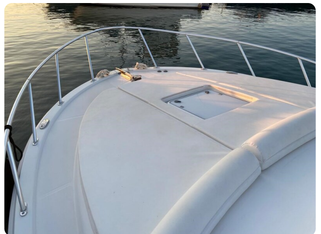
Cabo 36 Express bow deck