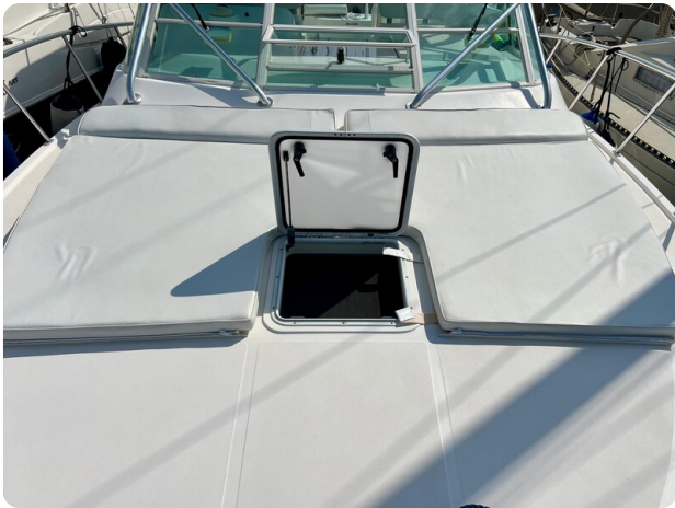
Cabo 32 Express fwd sunpad