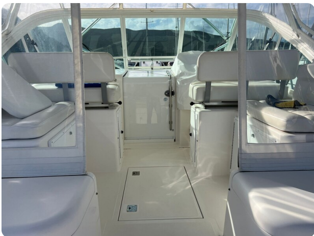
Cabo 32 Express, cockpit