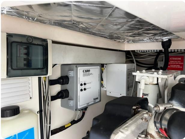
Cabo 32 Express, engine room