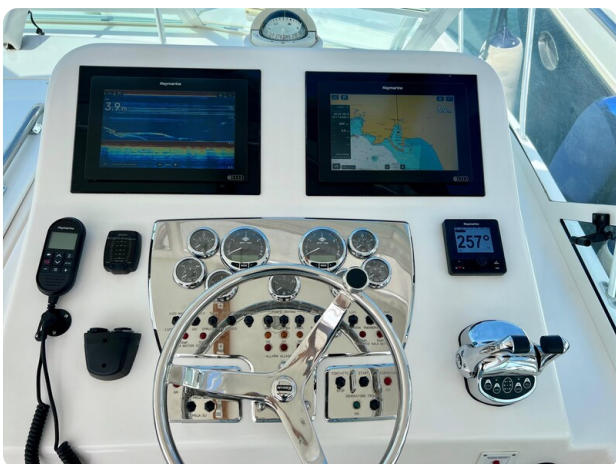
Cabo 32 Express helm