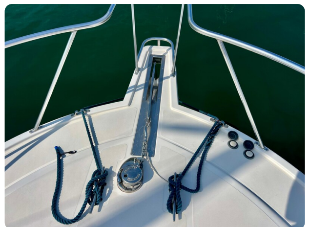
Cabo 32 Express bow pulpit