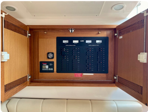
Cabo 32 Express electrical panel