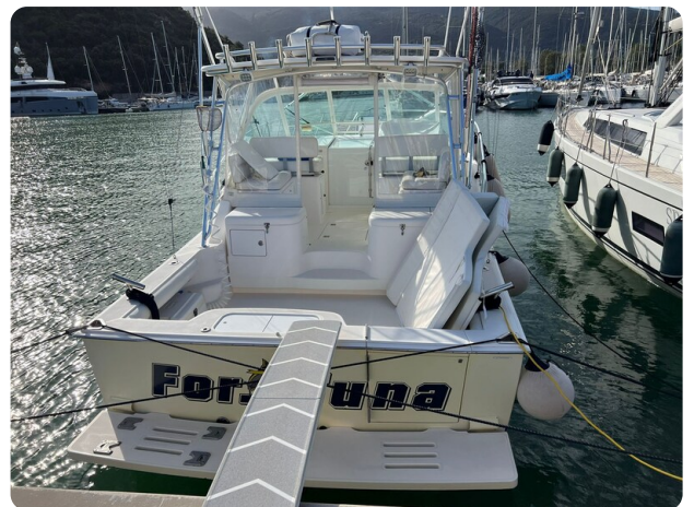
Cabo 32 Express, stern view