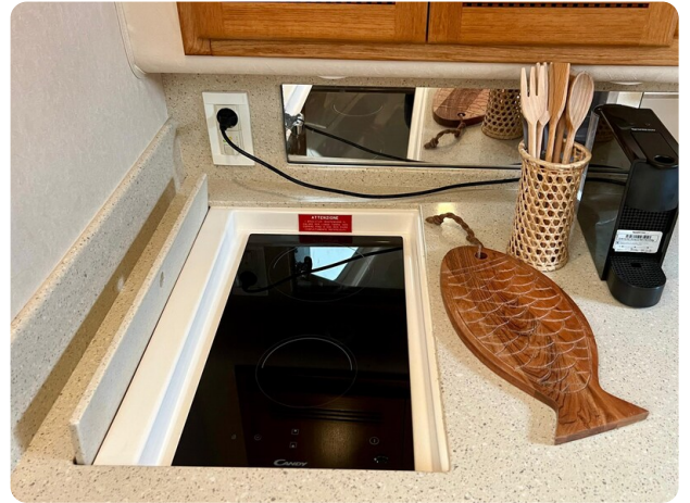
Cabo 32 Express cooktop