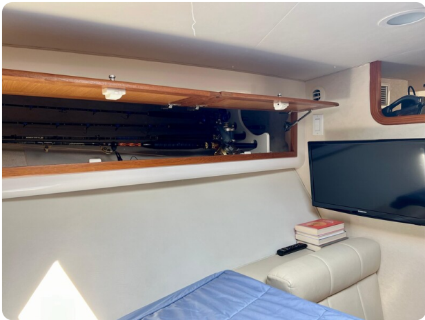
Cabo 32 Express dinette details