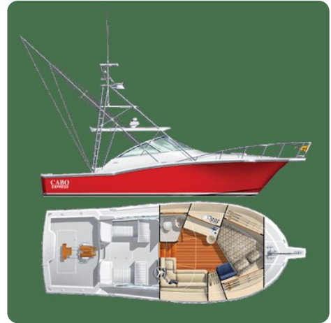
Cabo 32 Express, Layout