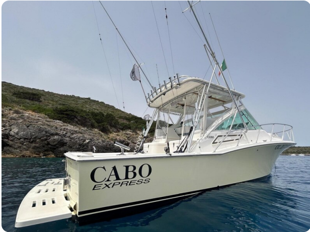
Cabo 32 Express, angle