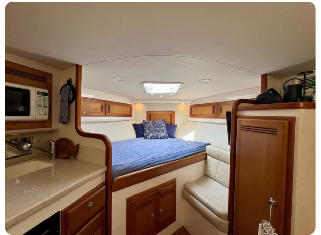
Cabo 32 Express cabin view