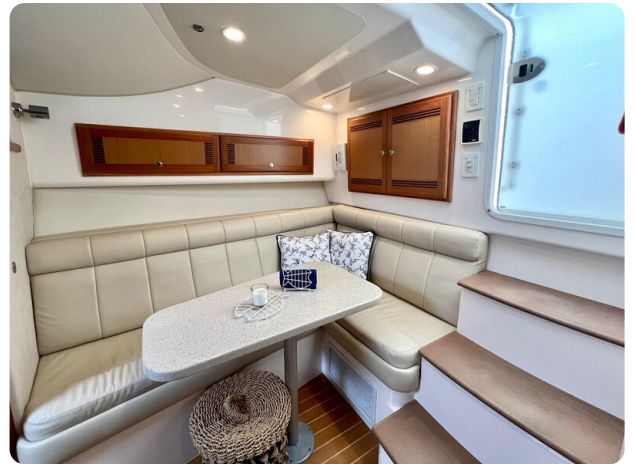
Cabo 32 Express dinette