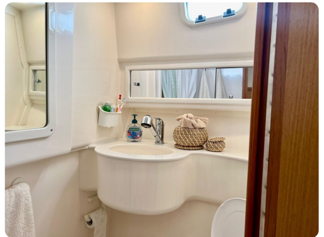
Cabo 32 Express bathroom