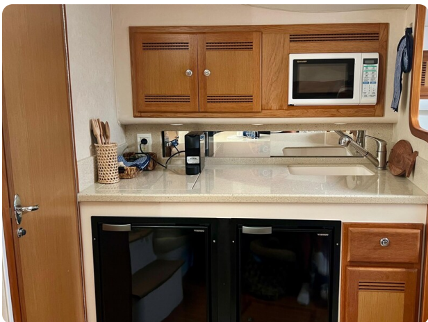
Cabo 32 Express galley view