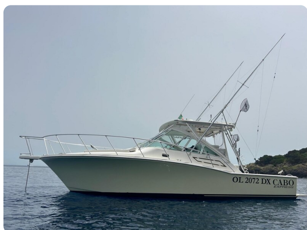
Cabo 32 Express, profile