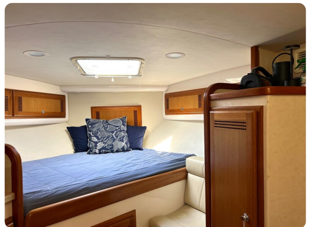
Cabo 32 Express cabin berth