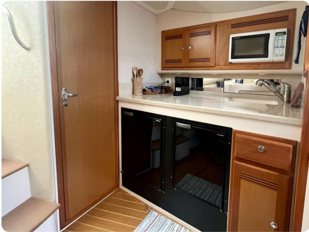
Cabo 32 Express galley