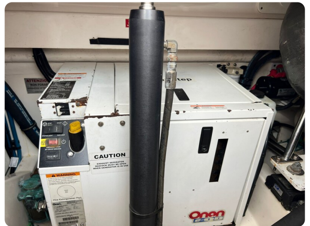
Cabo 32 Express, generator