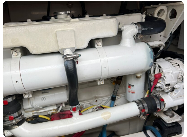
Cabo 32 Express, engine detail