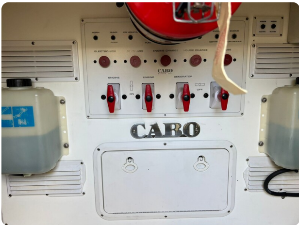
Cabo 32 Express, engine room detail