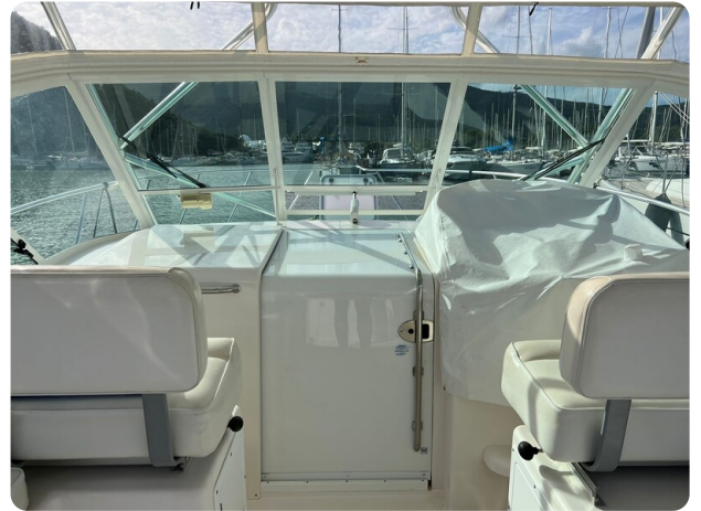
Cabo 32 Express, helm station area