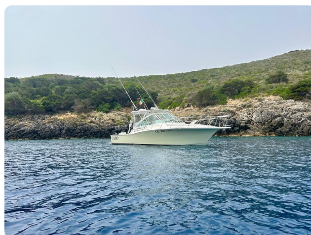
Cabo 32 Express, panoramic