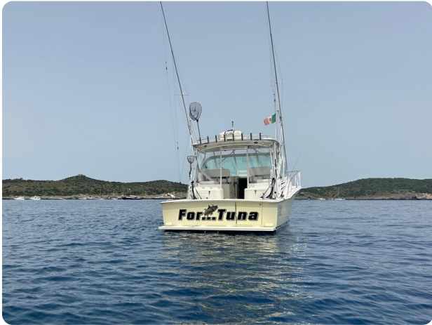
Cabo 32 Express, stern