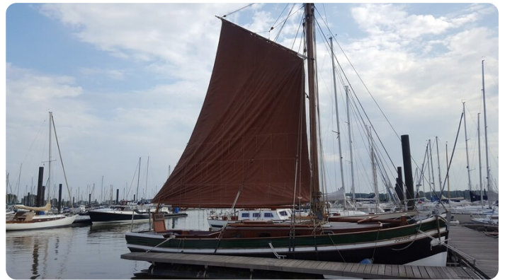
Bild1Bültjer Kutter msp625720 2