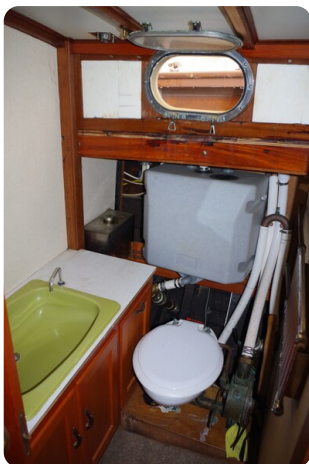
Bültjer Kutter msp625720 21