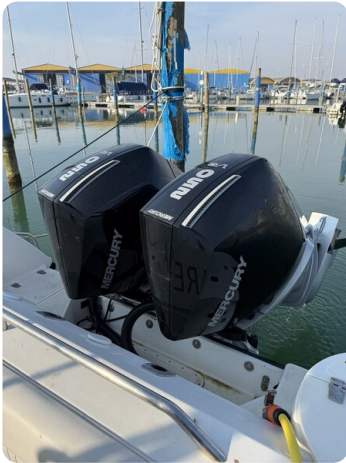
Boston 28 Outrage new engines