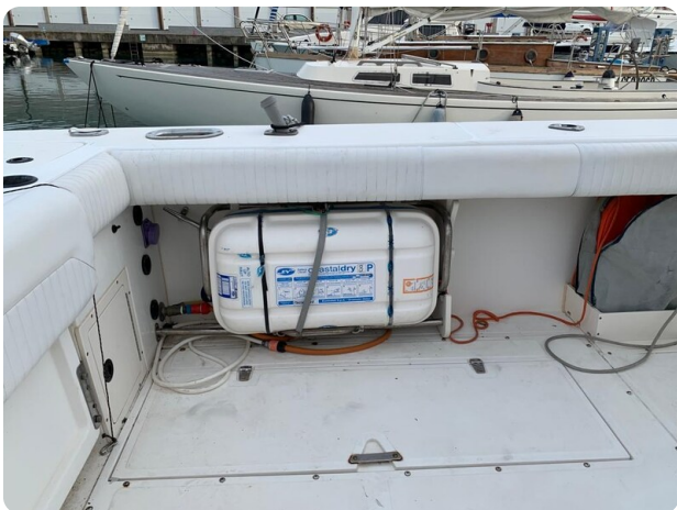
Boston 28 Outrage cockpit details