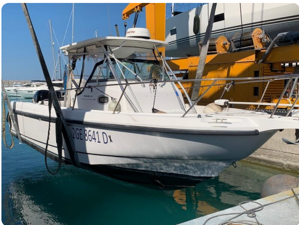
Boston 28 Outrage bow view