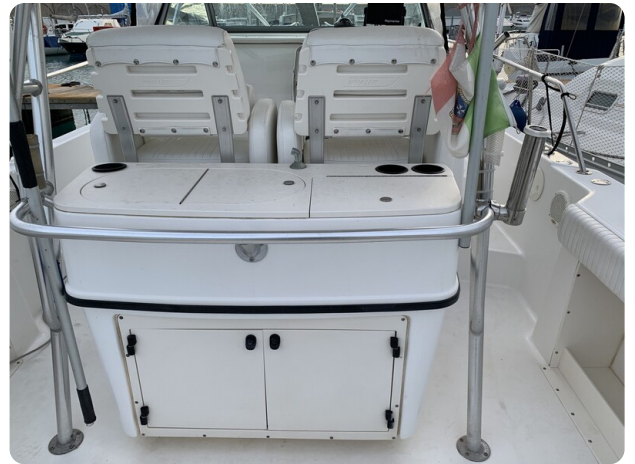
Boston 28 Outrage cockpit detail