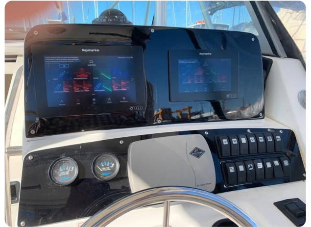
Boston 28 Outrage helm