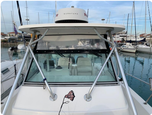
Boston 28 Outrage hard top detail