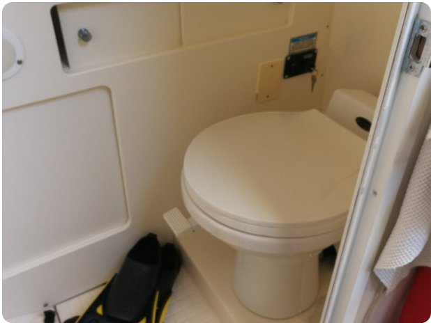
Boston 28 Outrage, bagno separato