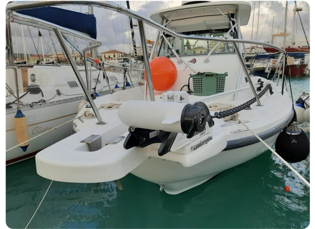
Boston 28 Outrage bow detail