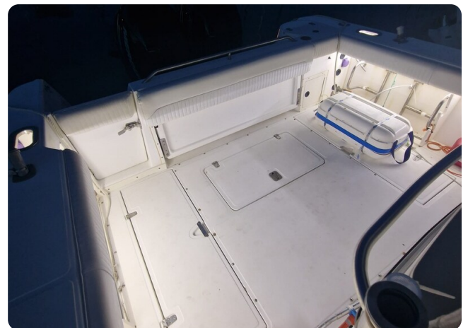
Boston 28 Outrage cockpit