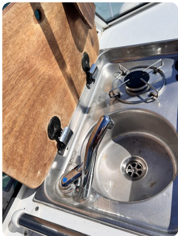
Boston Whaler 22 REVENGE