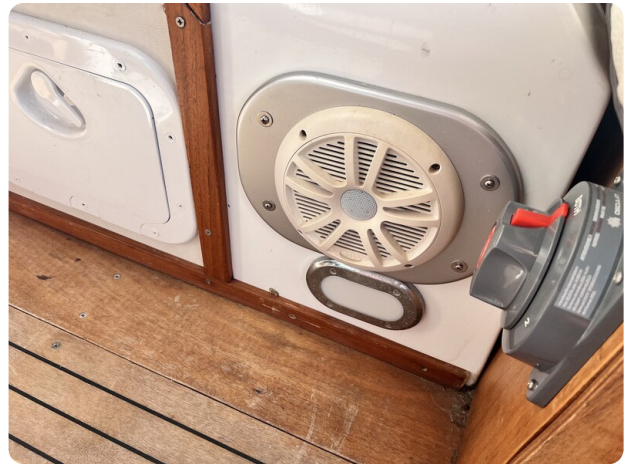
Boston Whaler 22 REVENGE