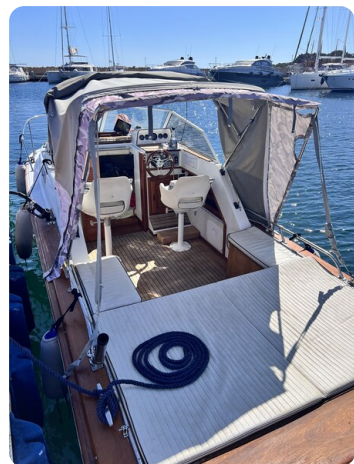
Boston Whaler 22 REVENGE