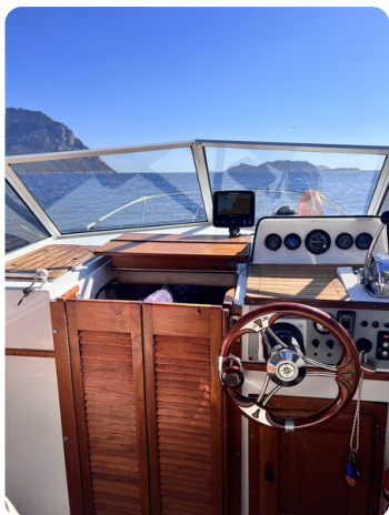
Boston Whaler 22 REVENGE