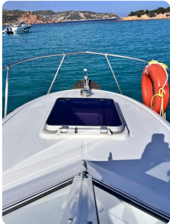
Boston Whaler 22 REVENGE