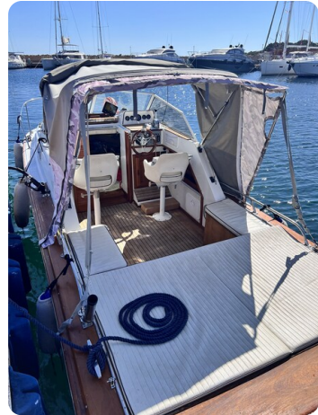
Boston Whaler 22 REVENGE