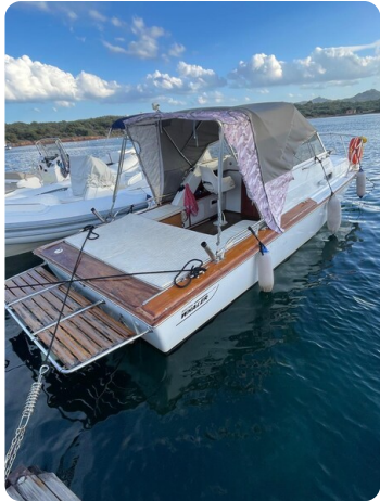
Boston Whaler 22 REVENGE