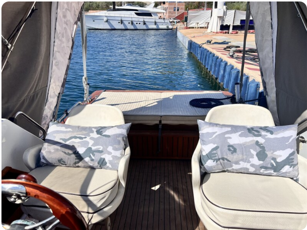
Boston Whaler 22 REVENGE