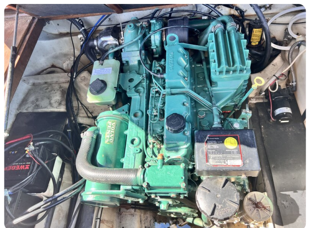
Boston Whaler 22 REVENGE engine