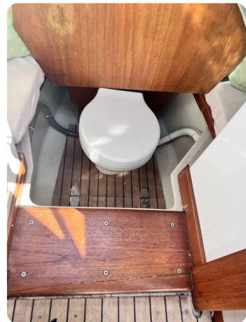
Boston Whaler 22 REVENGE