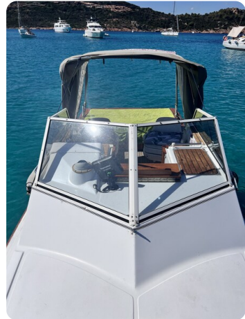
Boston Whaler 22 REVENGE