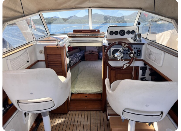
Boston Whaler 22 REVENGE