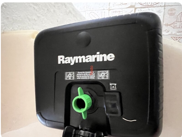
Boston Whaler 22 REVENGE Raymarine