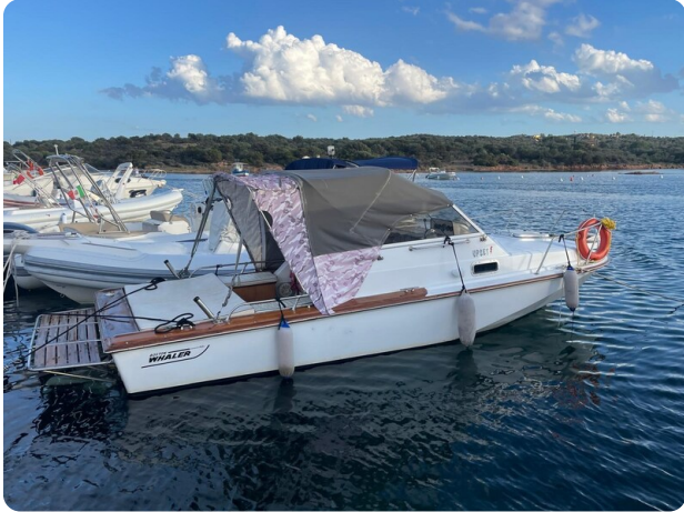
Boston Whaler 22 REVENGE