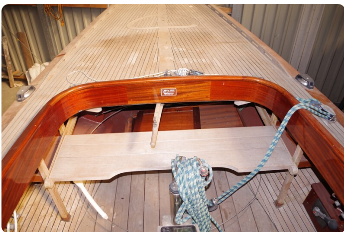
Schärenkreuzer FLORIAN 29