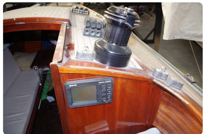
Schärenkreuzer FLORIAN 35