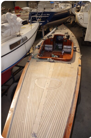
Schärenkreuzer FLORIAN 21