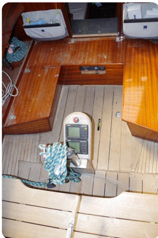
Schärenkreuzer FLORIAN 27