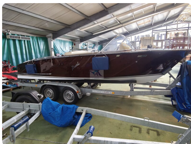
Boesch 590 Cabrio Deluxe CARPE DIEM 35