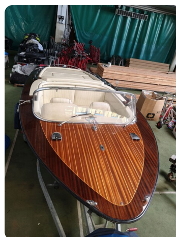
Boesch 590 Cabrio Deluxe CARPE DIEM 34