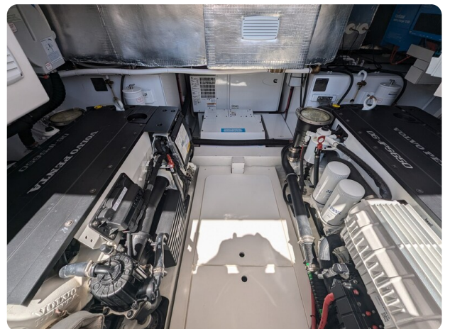
Bluegame 42 engine room