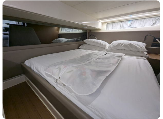
Bluegame 42 aft cabin