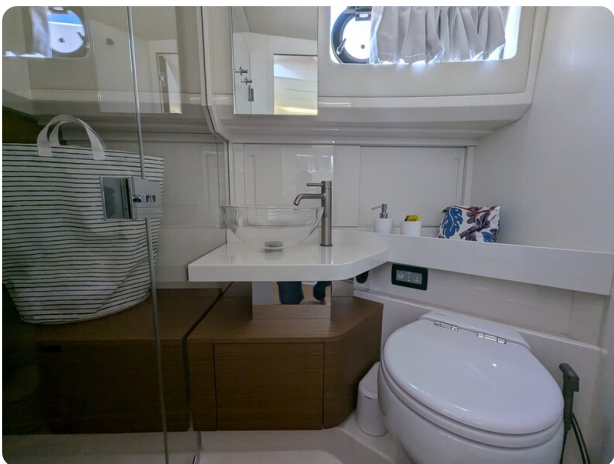
Bluegame 42 bathroom