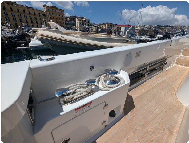
Bluegame 42 cockpit winches