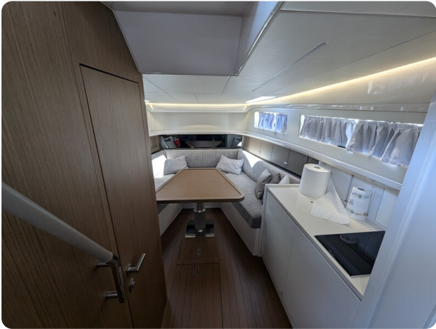
Bluegame 42 interiors