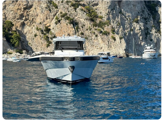
Bluegame 42 bow