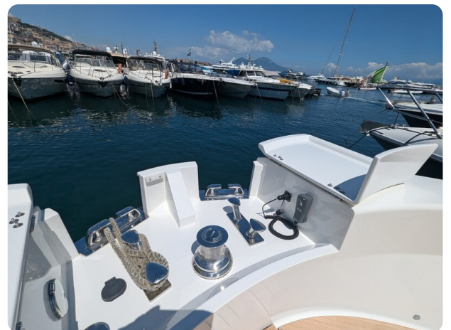
Bluegame 42 windlass detail