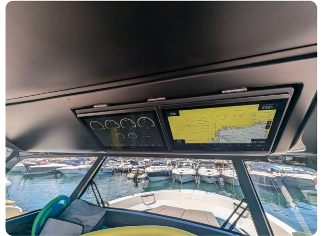
Bluegame 42 electronics