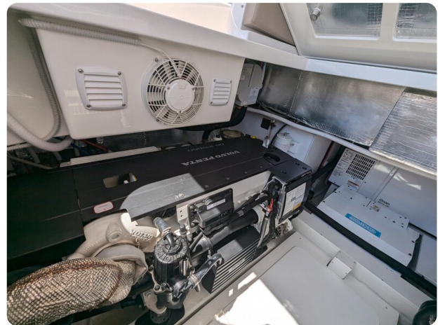
Bluegame 42 port engine