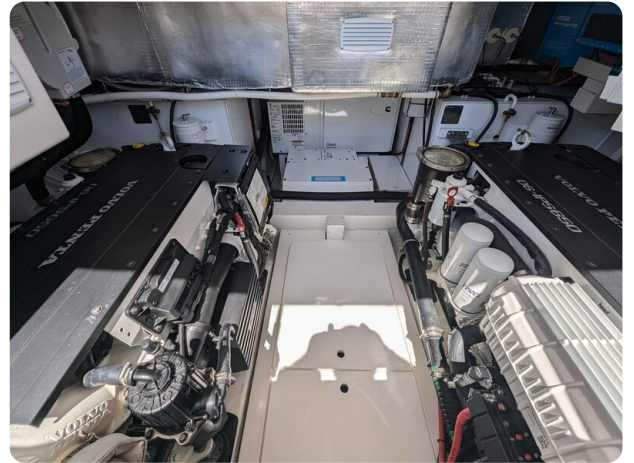
Bluegame 42 engine room