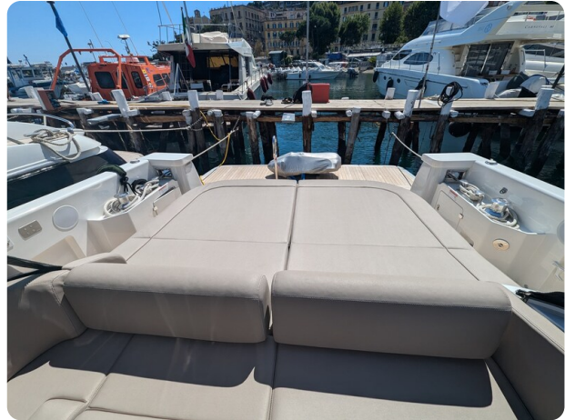
Bluegame 42 cockpit sunpad