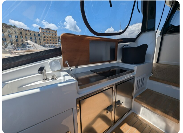
Bluegame 42 cockpit galley