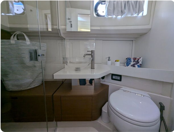
Bluegame 42 bathroom