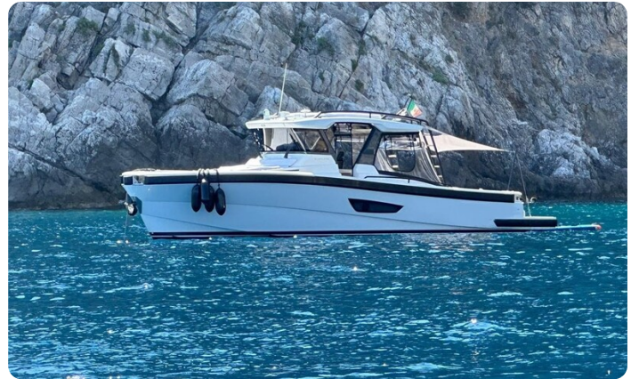
Bluegame 42 profile anchored 2