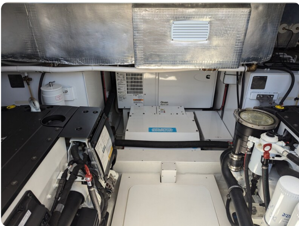
Bluegame 42 Onan generator