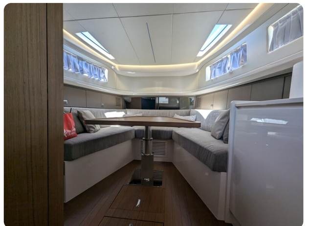
Bluegame 42 conv. dinette