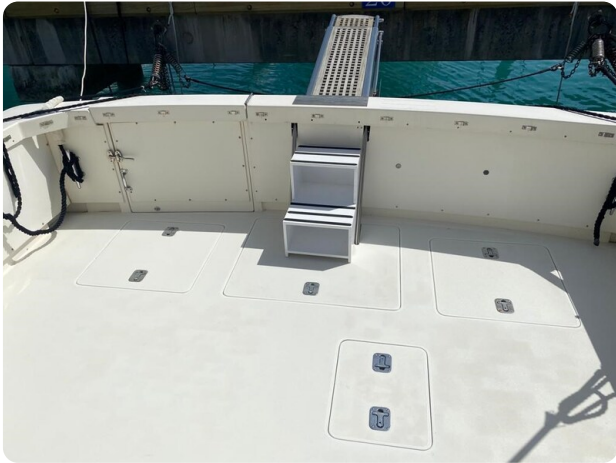
Bertram 37, aft cockpit