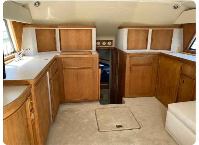
Bertram 37, salon