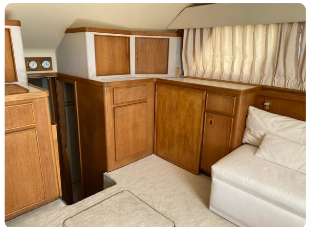
Bertram 37, salon detail