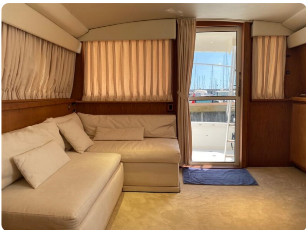
Bertram 37, salon to aft