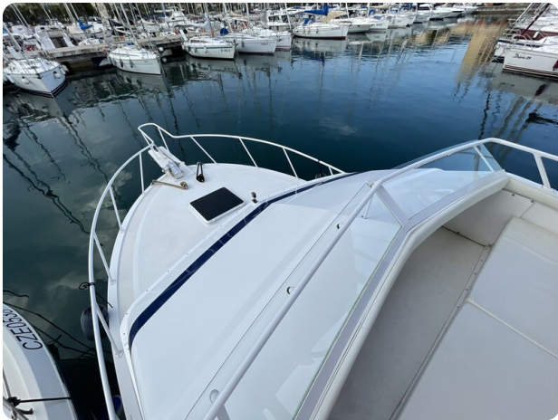
Bertram 33 Sport Fisherman13