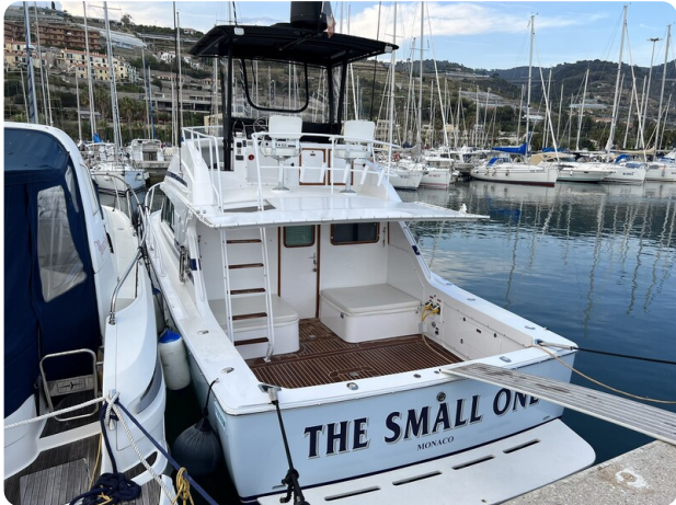
Bertram 33 Sport Fisherman1