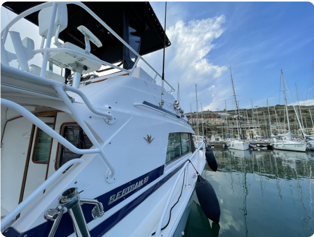
Bertram 33 Sport Fisherman19