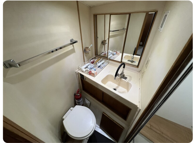
Bertram 33 Sport Fisherman6