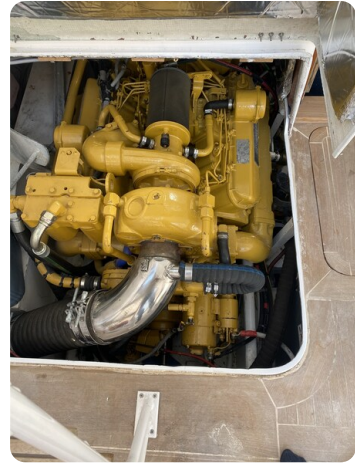
Bertram 33 Sport Fisherman24