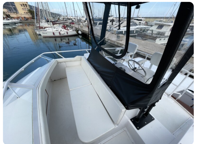
Bertram 33 Sport Fisherman16