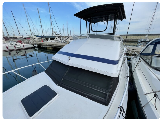
Bertram 33 Sport Fisherman20