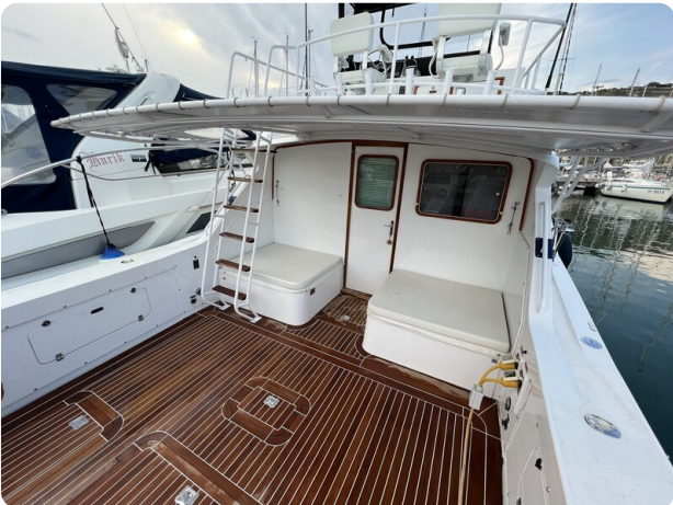
Bertram 33 Sport Fisherman2