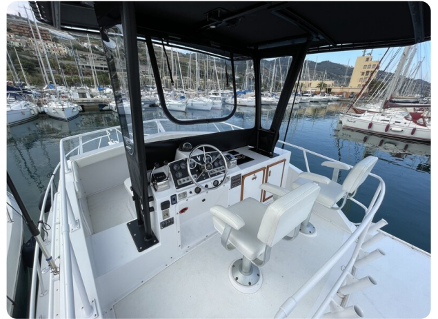
Bertram 33 Sport Fisherman17