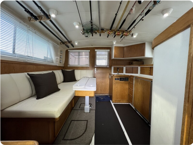
Bertram 33 Sport Fisherman11