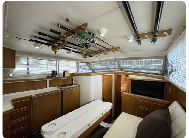
Bertram 33 Sport Fisherman8