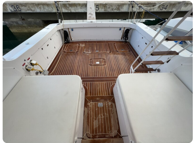
Bertram 33 Sport Fisherman