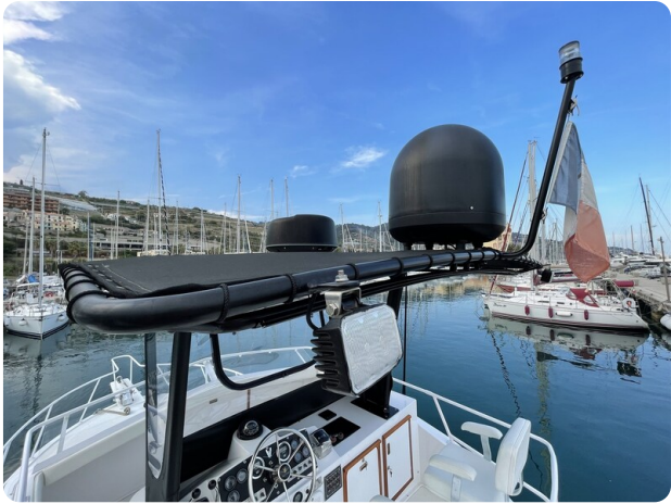
Bertram 33 Sport Fisherman18