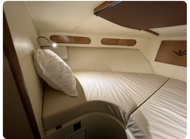
Bertram 33 Sport Fisherman4