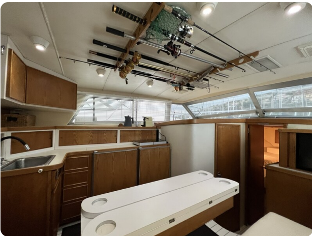
Bertram 33 Sport Fisherman9