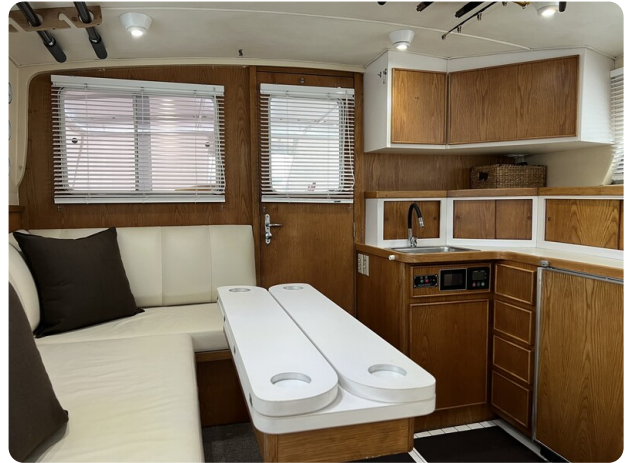
Bertram 33 Sport Fisherman12