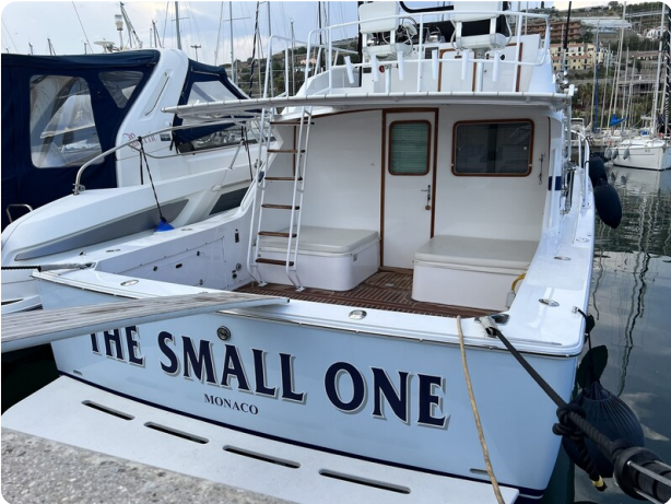
Bertram 33 Sport Fisherman