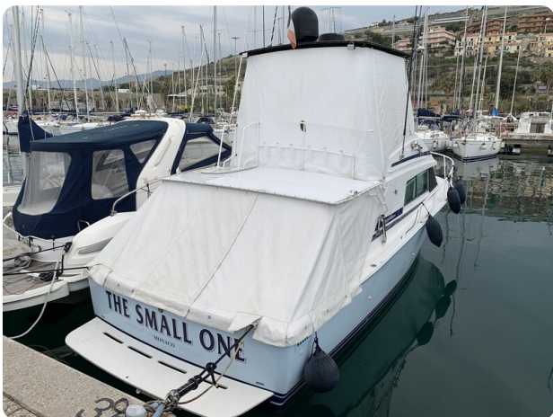
Bertram 33 Sport Fisherman23