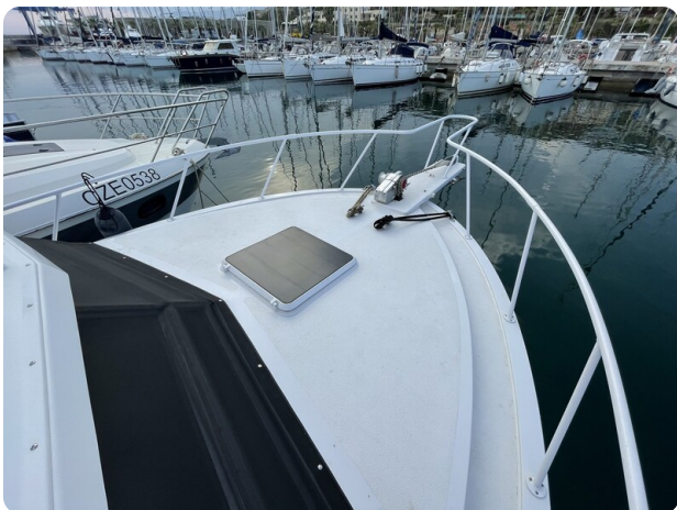
Bertram 33 Sport Fisherman22