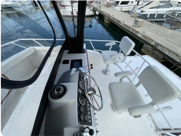
Bertram 33 Sport Fisherman15