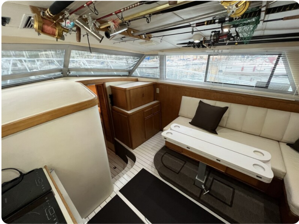
Bertram 33 Sport Fisherman10