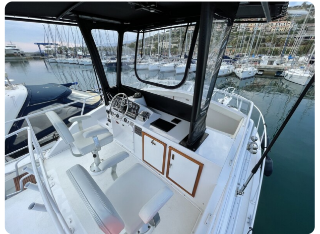
Bertram 33 Sport Fisherman14