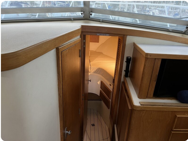
Bertram 33 Sport Fisherman5