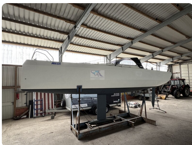
Bente 24 MUGGEL 13