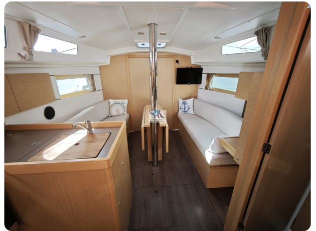
Oceanis 35.1 10