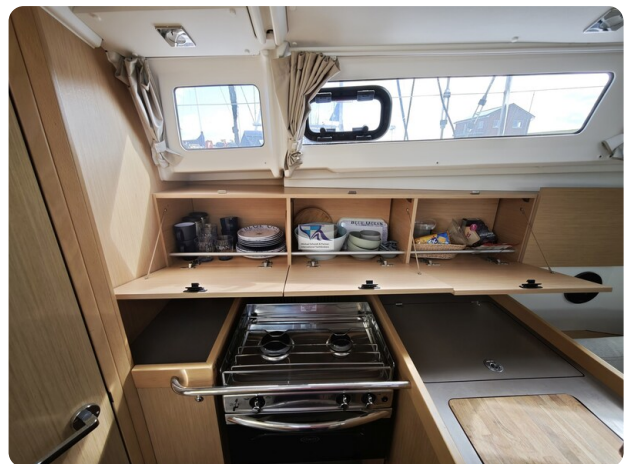
Oceanis 35.1 21