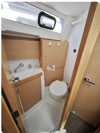
Oceanis 35.1 31