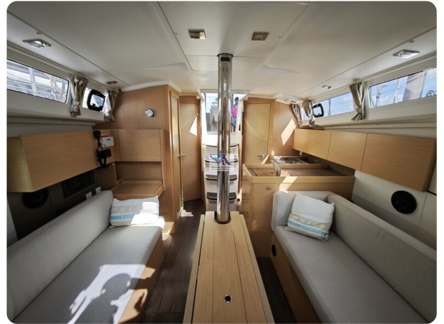
Oceanis 35.1 28