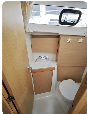
Oceanis 35.1 32