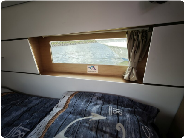
Oceanis 35.1 27