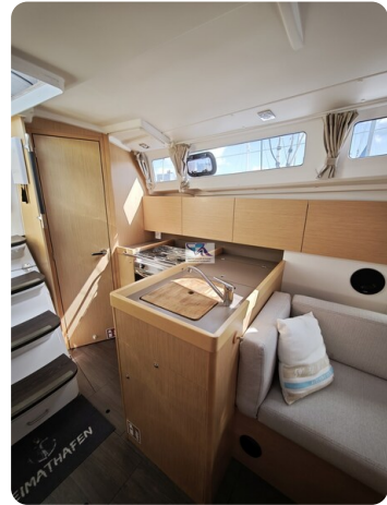
Oceanis 35.1 18