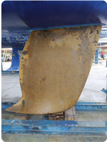
Immagine WhatsApp 2023-03-08 ore 19.00.17_f42b73bc