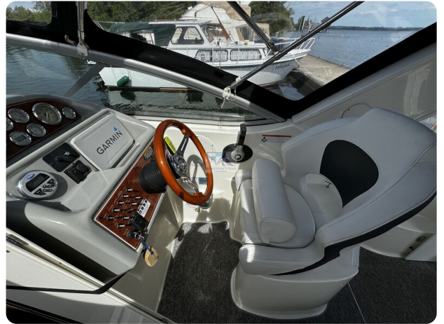
Bayliner 285 - MSP 34