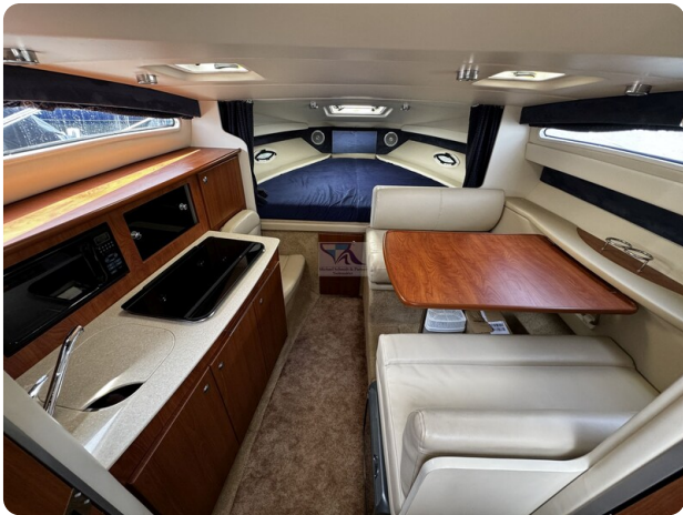
Bayliner 285 - MSP 11