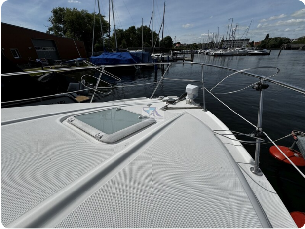
Bayliner 285 - MSP 46