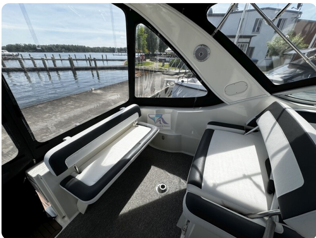
Bayliner 285 - MSP 39