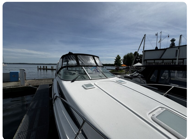
Bayliner 285 - MSP 45