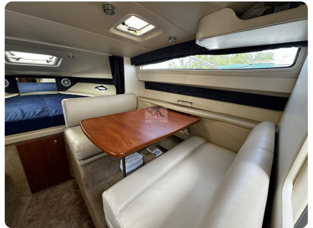
Bayliner 285 - MSP 5