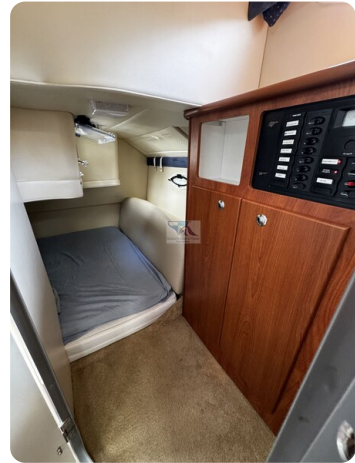
Bayliner 285 - MSP 18