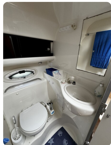
Bayliner 285 - MSP 25