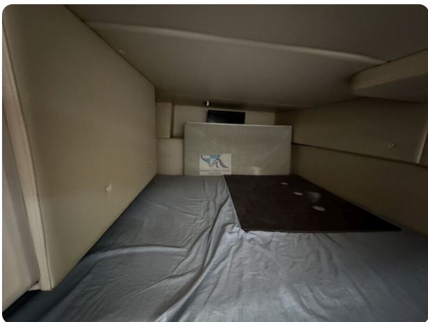
Bayliner 285 - MSP 20