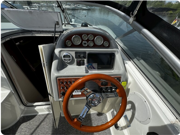
Bayliner 285 - MSP 33