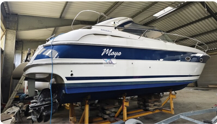
Bavaria 37 Sport msp793423 1