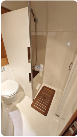
Bavaria 37 Sport msp793423 62