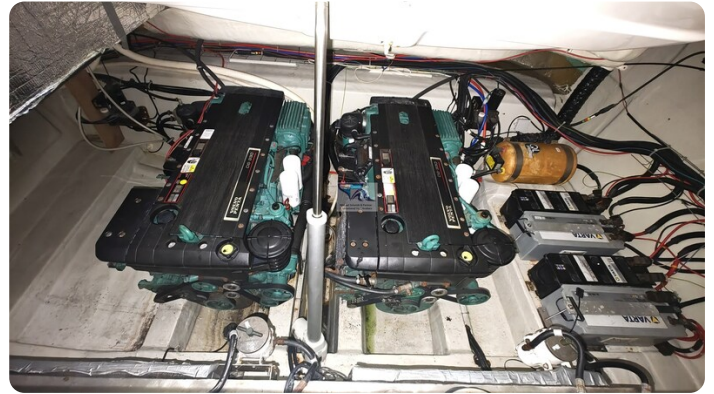
Bavaria 37 Sport msp793423 36