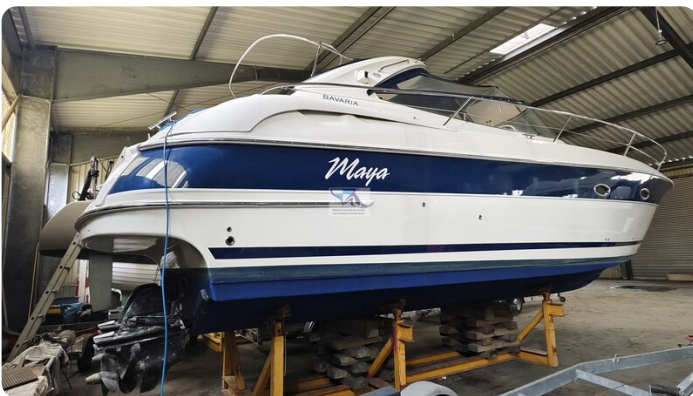
Bavaria 37 Sport msp793423 1