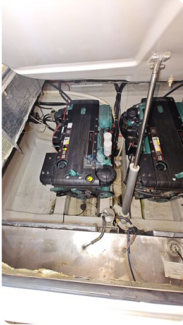
Bavaria 37 Sport msp793423 41