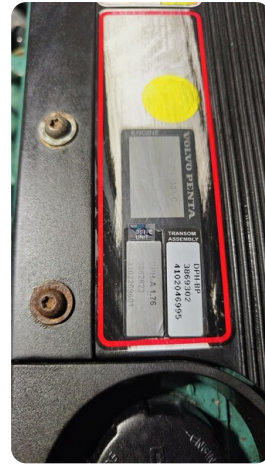
Bavaria 37 Sport msp793423 33