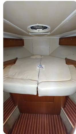
Bavaria 37 Sport msp793423 76