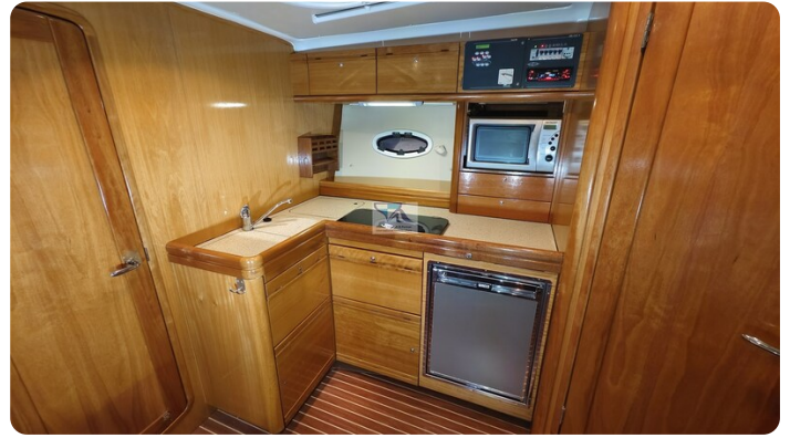
Bavaria 37 Sport msp793423 63