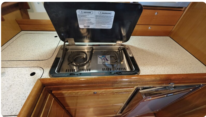
Bavaria 37 Sport msp793423 68