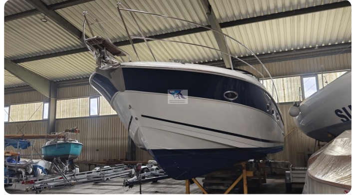
Bavaria 37 Sport msp793423 7