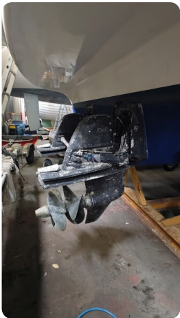
Bavaria 37 Sport msp793423 2