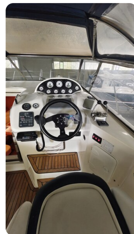
Bavaria 37 Sport msp793423 25