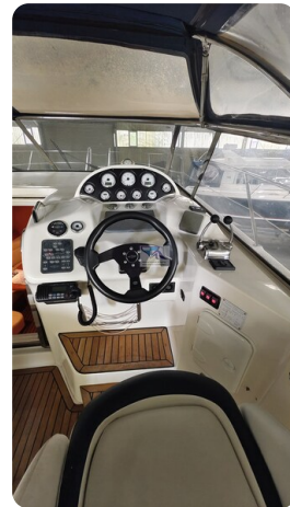
Bavaria 37 Sport msp793423 25