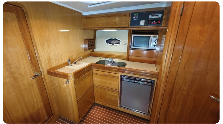
Bavaria 37 Sport msp793423 63