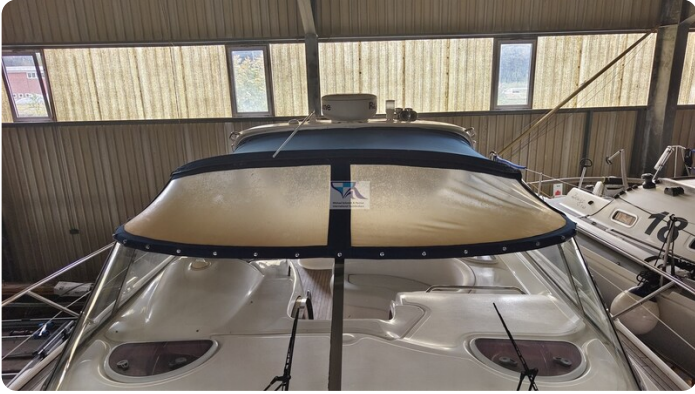
Bavaria 37 Sport msp793423 16