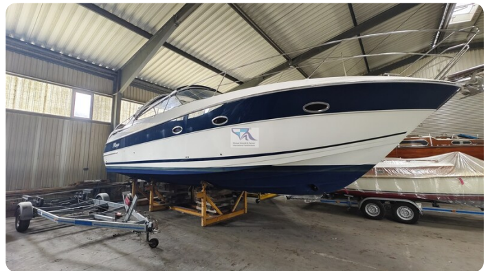
Bavaria 37 Sport msp793423 4