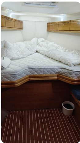
Bavaria 37 msp749314 VS