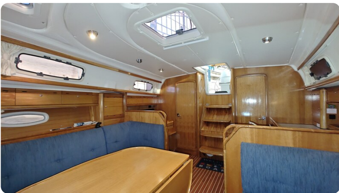
Bavaria 37 msp749314 22