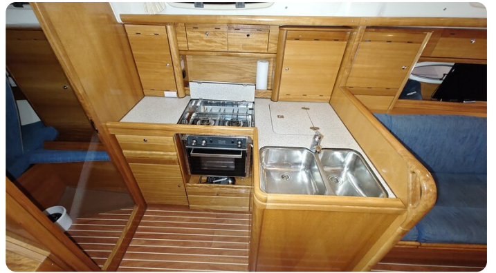
Bavaria 37 msp749314 14