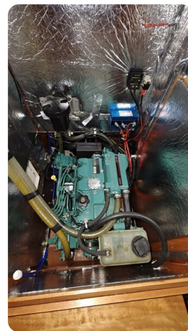
Bavaria 37 msp749314 23