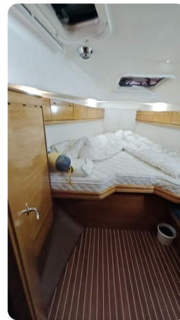
Bavaria 37 msp749314 VS2