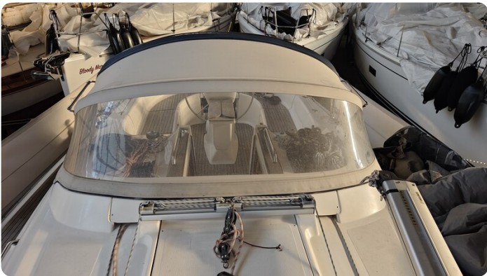
Bavaria 37 msp749314 8