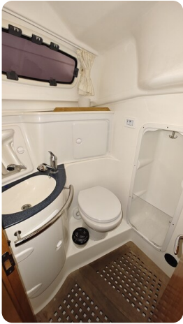
Bavaria 37 msp749314 17