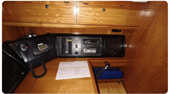
Bavaria 37 msp749314 16