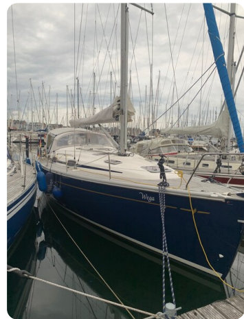
Bavaria 37 msp749314 3