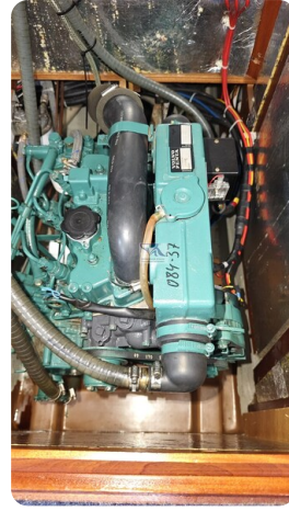
Bavaria 37_msp 25