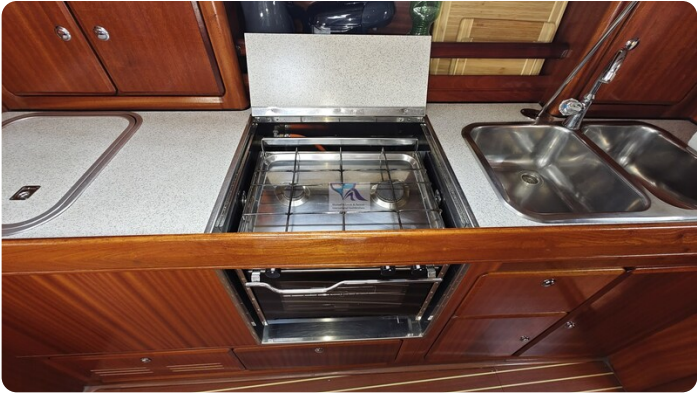
Bavaria 37_msp 31