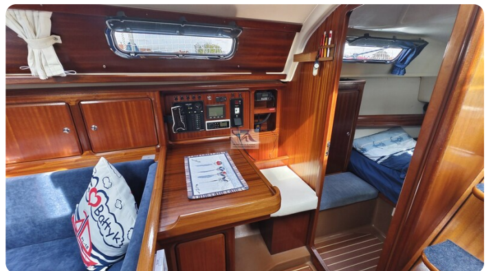
Bavaria 37_msp 15