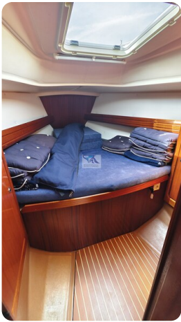
Bavaria 37_msp 21