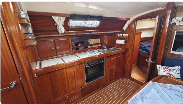
Bavaria 37_msp 14