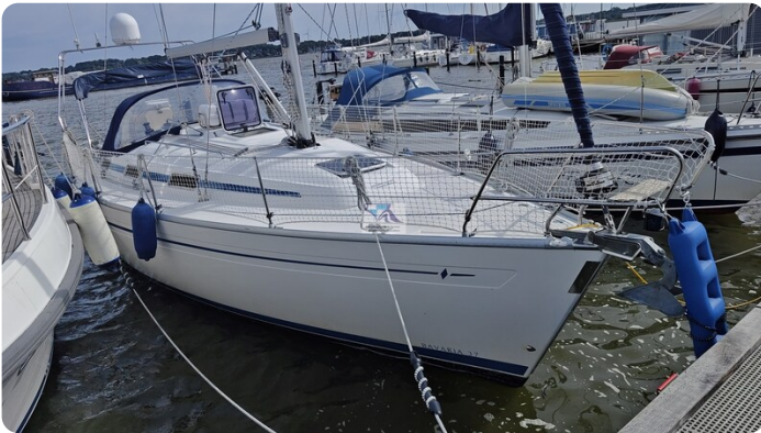
Bavaria 37_msp 49