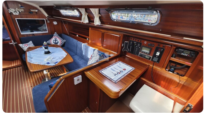
Bavaria 37_msp 12