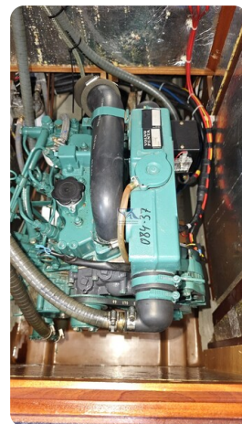
Bavaria 37_msp 25