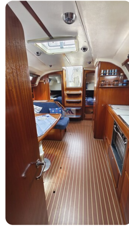
Bavaria 37_msp 24