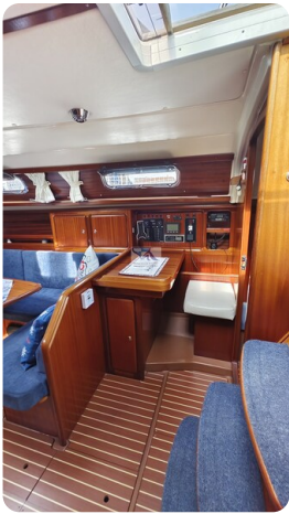
Bavaria 37_msp 7