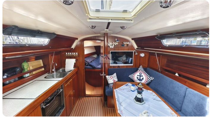
Bavaria 37_msp 20