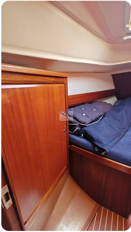
Bavaria 37_msp 23