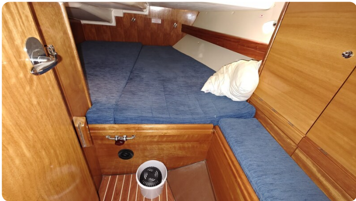
Bavaria 37 msp749314 15