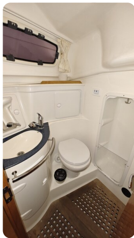
Bavaria 37 msp749314 17