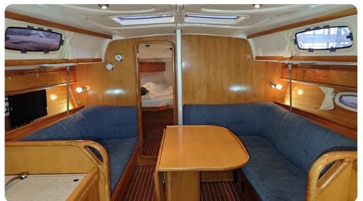
Bavaria 37 msp749314 12