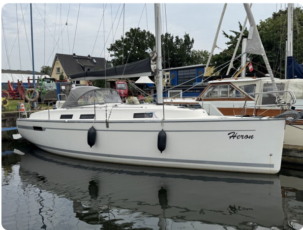
Bavaria 32 Cruiser HERON 6