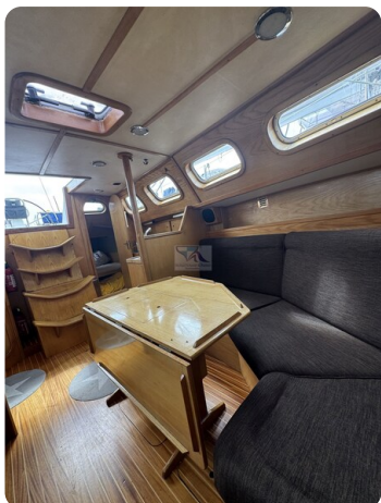
Baron 38 DER LETZTE BARON 52