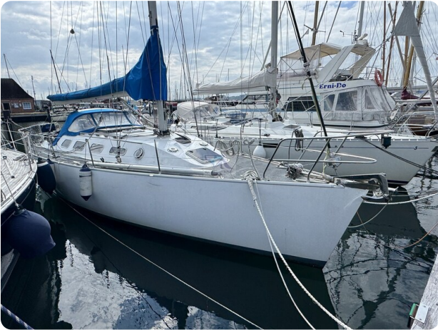
Baron 38 DER LETZTE BARON 20