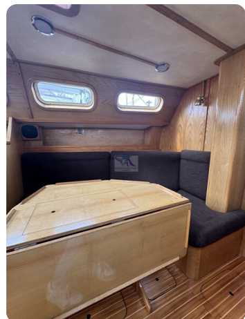
Baron 38 DER LETZTE BARON 59