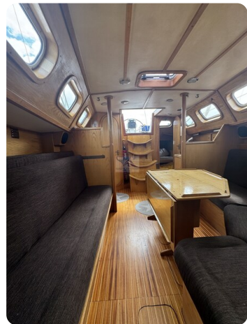
Baron 38 DER LETZTE BARON 53