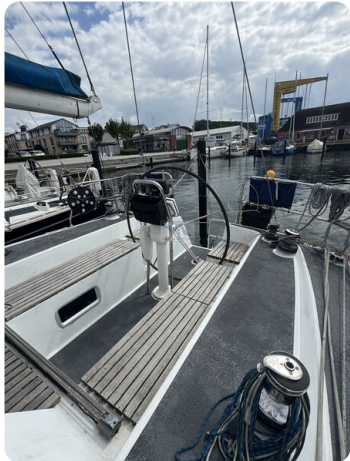
Baron 38 DER LETZTE BARON 46