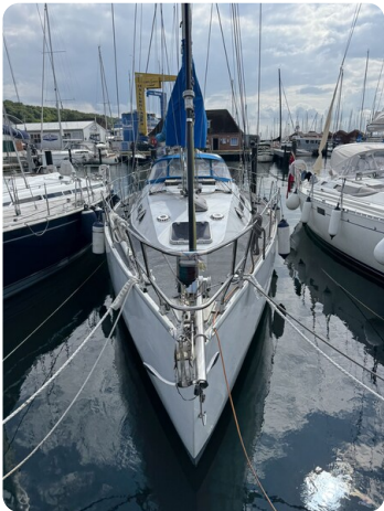
Baron 38 DER LETZTE BARON 23