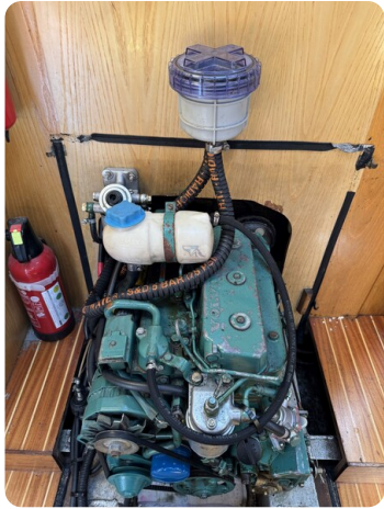
Baron 38 DER LETZTE BARON 6