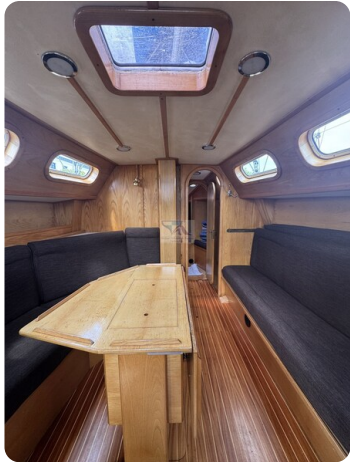
Baron 38 DER LETZTE BARON 72