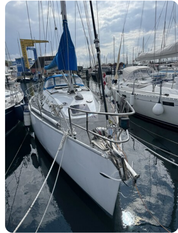
Baron 38 DER LETZTE BARON 22