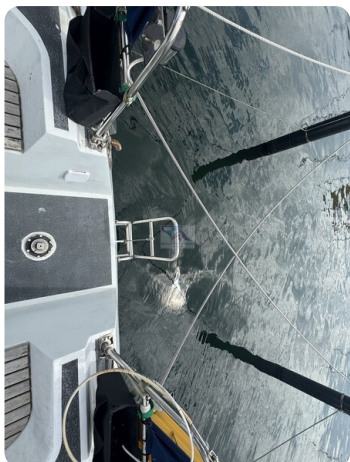
Baron 38 DER LETZTE BARON 44