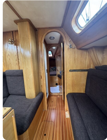
Baron 38 DER LETZTE BARON 58