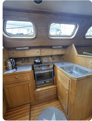
Baron 38 DER LETZTE BARON 71