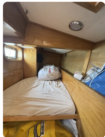
Baron 38 DER LETZTE BARON 68