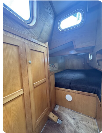
Baron 38 DER LETZTE BARON 62