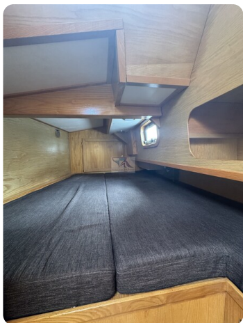
Baron 38 DER LETZTE BARON 61