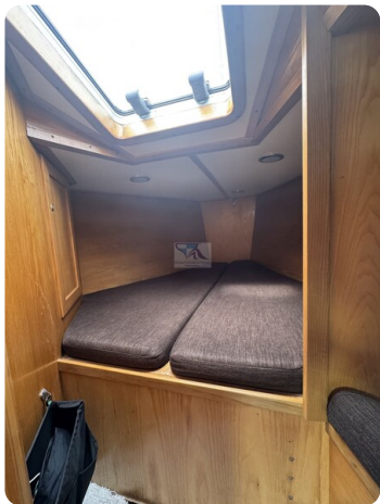
Baron 38 DER LETZTE BARON 55