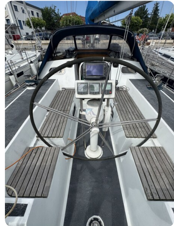
Baron 38 DER LETZTE BARON 43