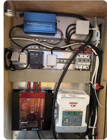
Baron 38 DER LETZTE BARON 67