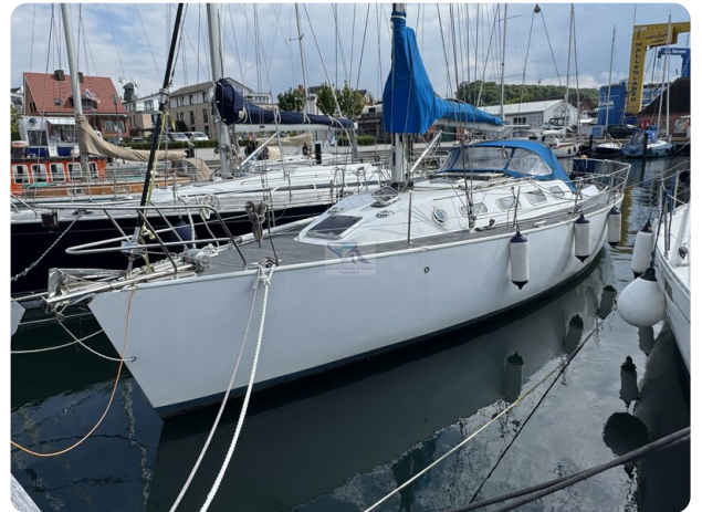
Baron 38 DER LETZTE BARON 25