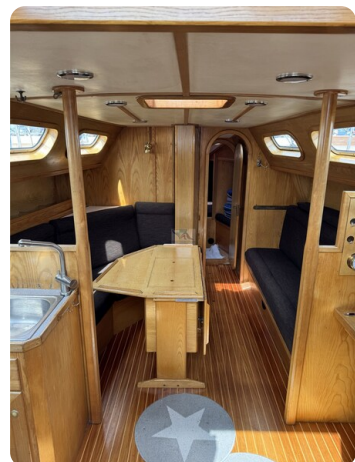
Baron 38 DER LETZTE BARON 76