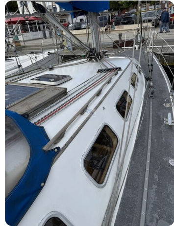
Baron 38 DER LETZTE BARON 34