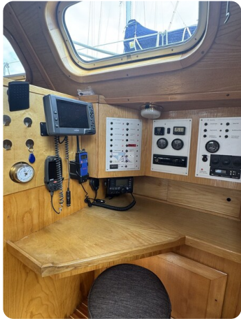
Baron 38 DER LETZTE BARON 75