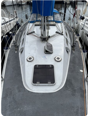
Baron 38 DER LETZTE BARON 30