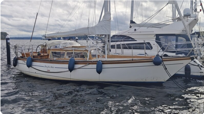
Baltika Decksalon SY 2