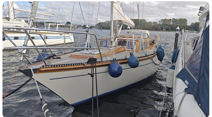
Baltika Decksalon SY 4