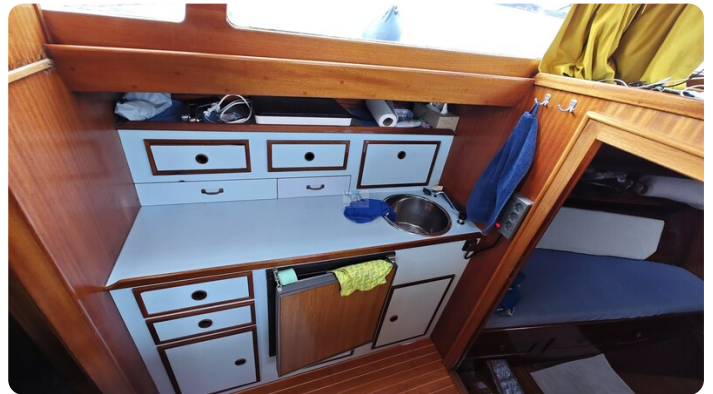
Baltika Decksalon SY 22