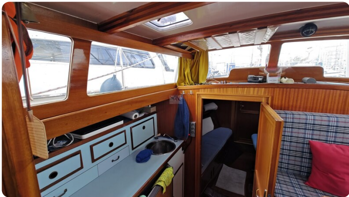
Baltika Decksalon SY 21