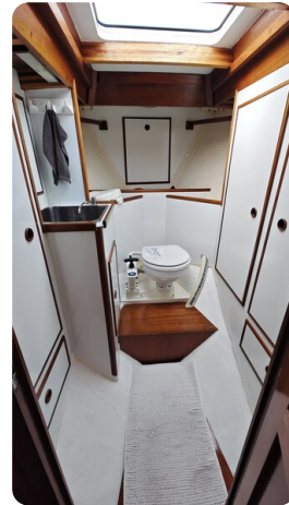
Baltika Decksalon SY 25