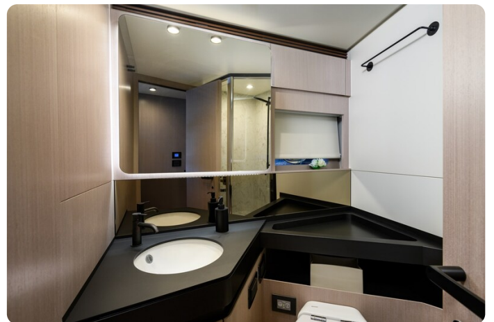
Azimut S7New Vip bathroom