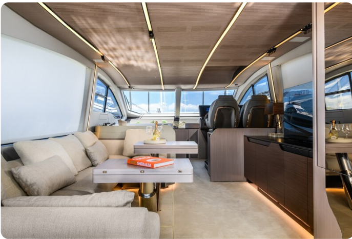
Azimut S7New salon to bow