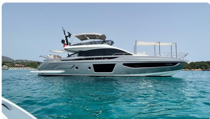
Azimut S7New anchored