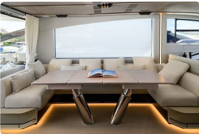
Azimut S7New dinette detail