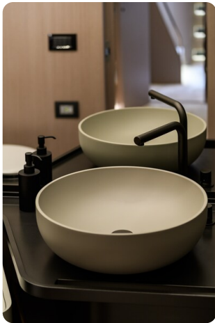
Azimut S7New bathroom detail