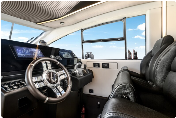
Azimut S7New helm station