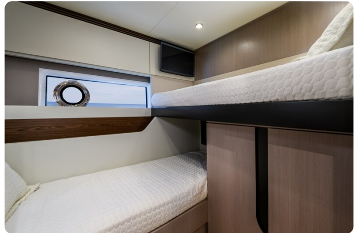
Azimut S7New L guest cabin