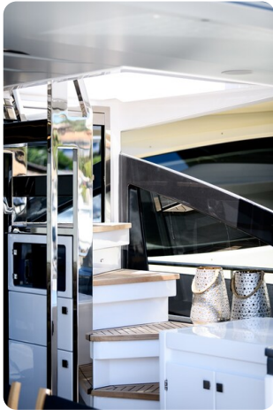
Azimut S7New cockpit stairs