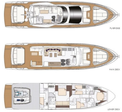
Azimut S7New, Layout