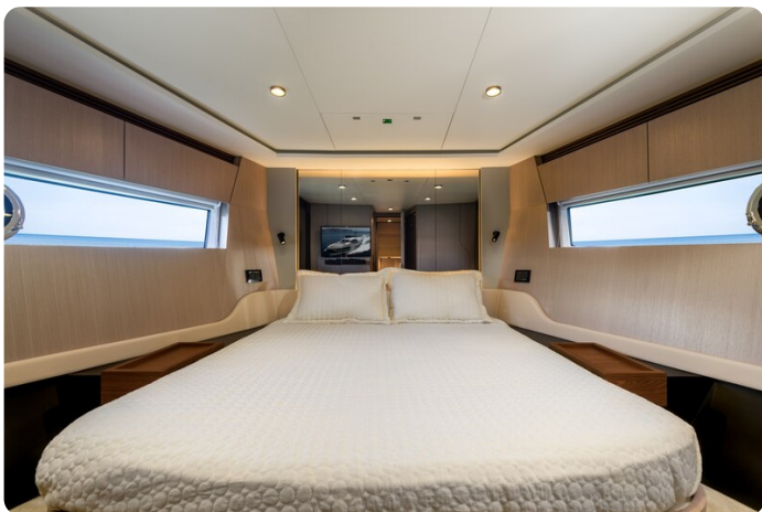
Azimut S7New Vip cabin