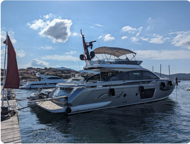
Azimut S7New aft profile