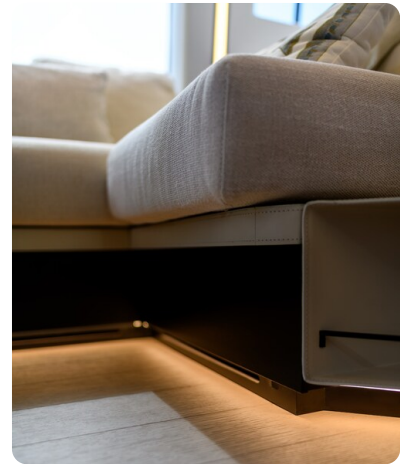
Azimut S7New salon detail