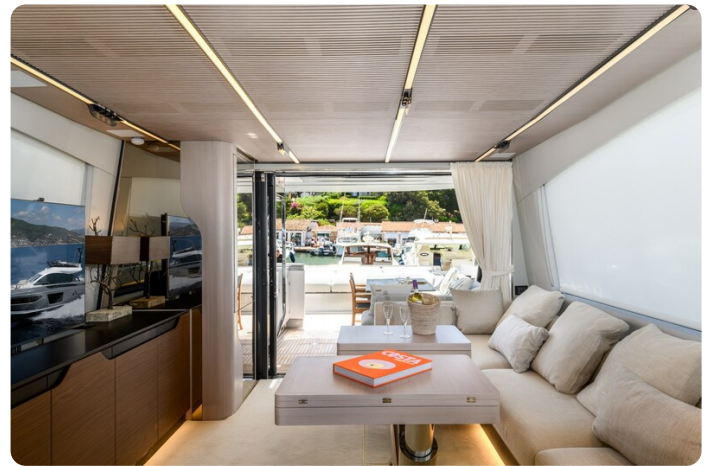
Azimut S7New salon to aft