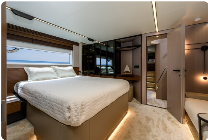
Azimut S7New, owner's cabin