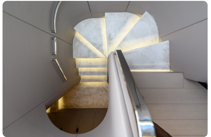
Azimut S7New interior details