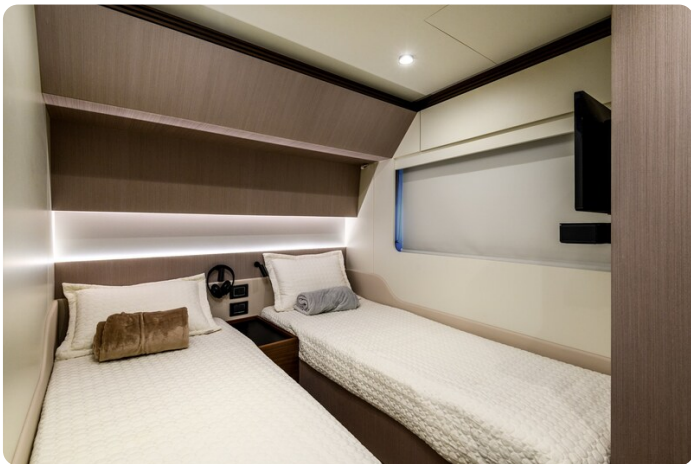
Azimut S7New guest cabin