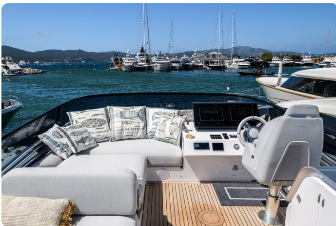
Azimut S7New, Flybridge helm station