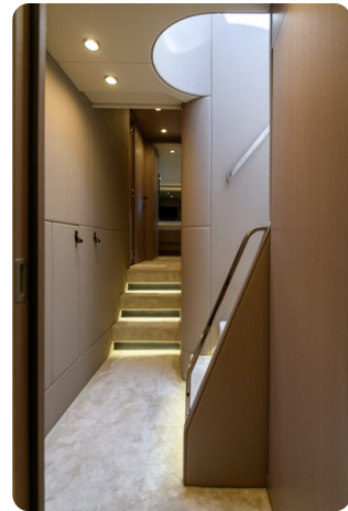
Azimut S7New companionway