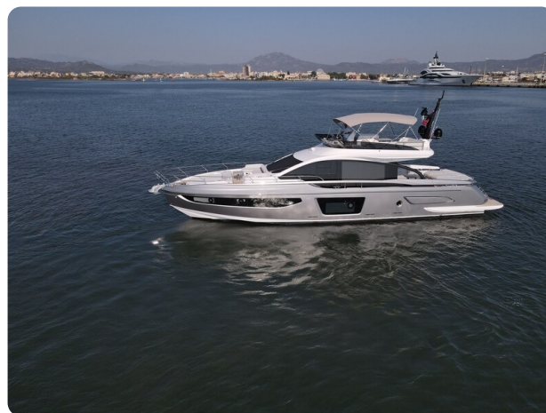
Azimut S7New aerial view