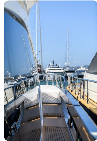
Azimut S7New sideways