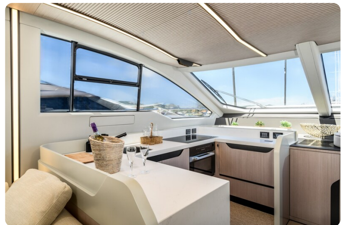
Azimut S7New galley