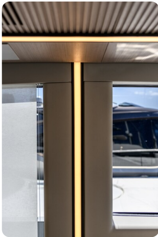
Azimut S7New lighting detail