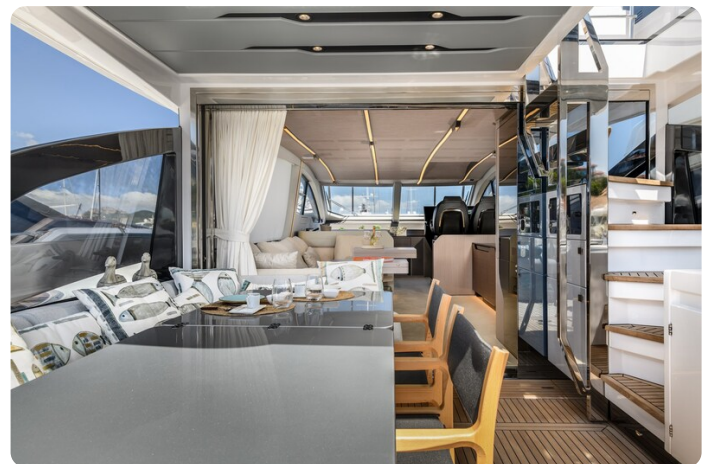
Azimut S7New cockpit and salon