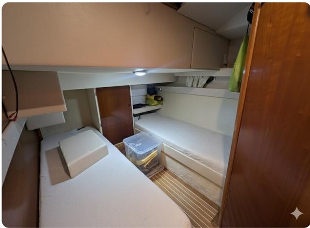
{1} Guest cabin