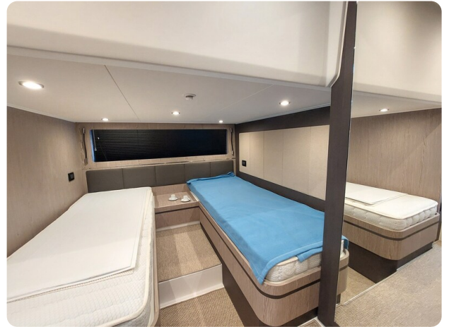
Azimut Atlantis 45 guest cabin