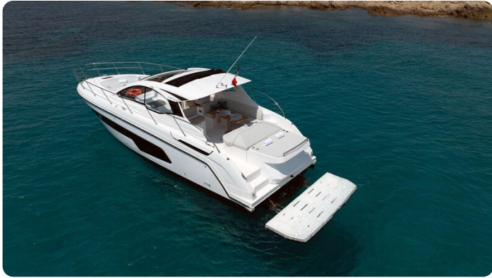
Atlantis 45 aerial view