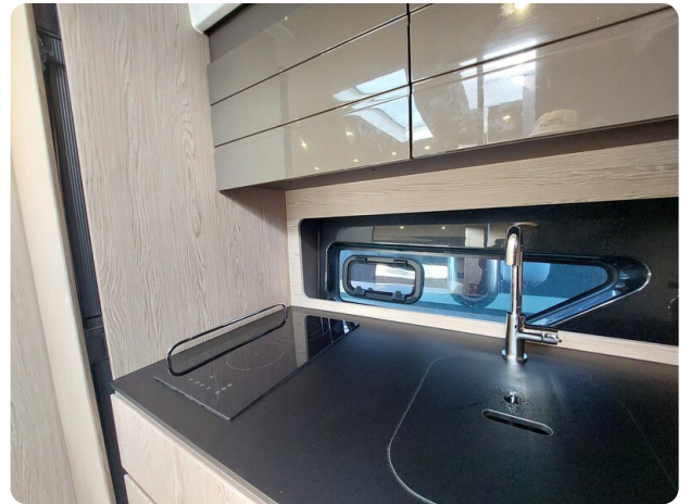
Azimut Atlantis 45 galley