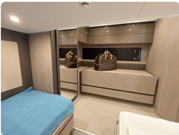
Azimut Atlantis 45 guest cabin detail