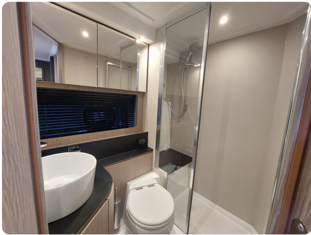
Azimut Atlantis 45 bathroom