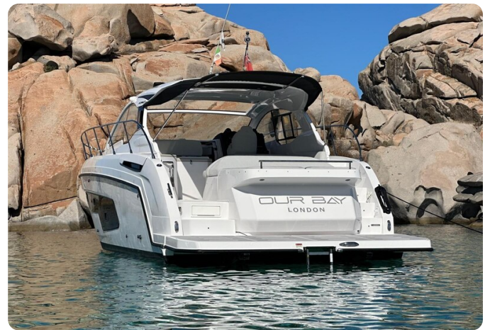
Atlantis 45 aft view