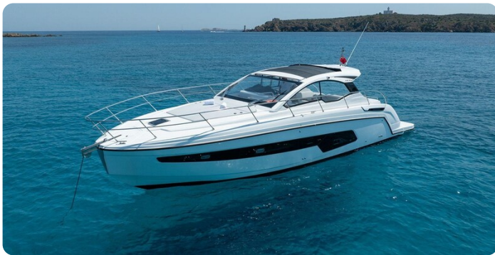
A45 Exterior View