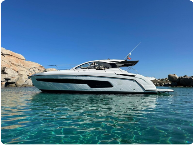
A45 Exterior View 1.jpg