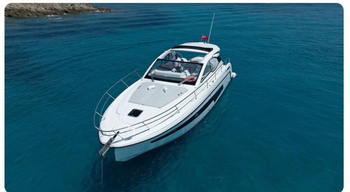
A45 Exterior View