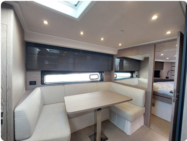
Azimut Atlantis 45 dinette