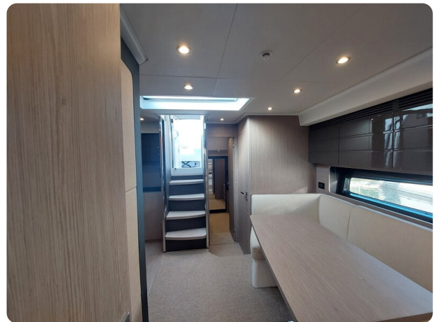
Azimut Atlantis 45 interiors