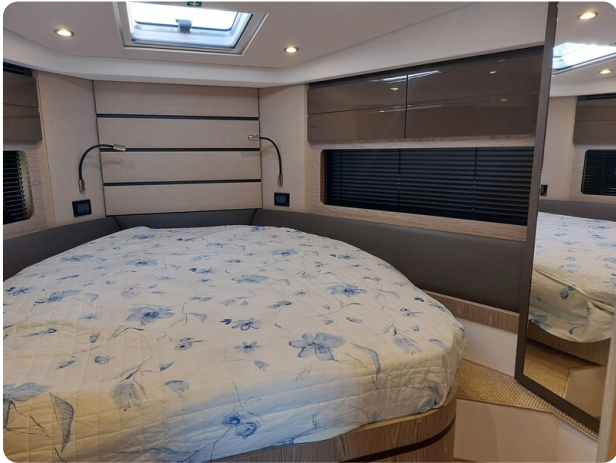
Azimut Atlantis 45 Owners cabin