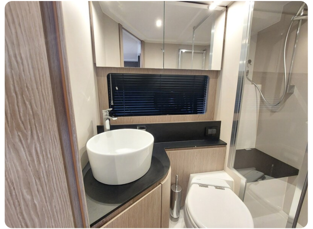
Azimut Atlantis 45 bathroom view