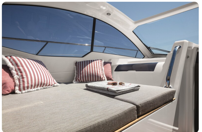
A45 Relax Area