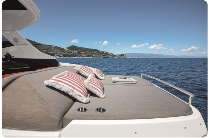
A45 Aft Sunpad 2