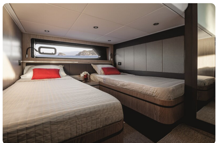
A45 Guest Cabin Twin beds