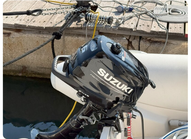
New tender's engine