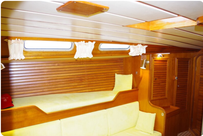
Avance 40 msp636285 15