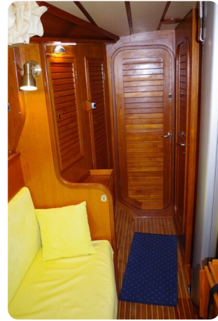
Avance 40 msp636285 12