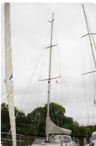
Avance 40 msp636285 7