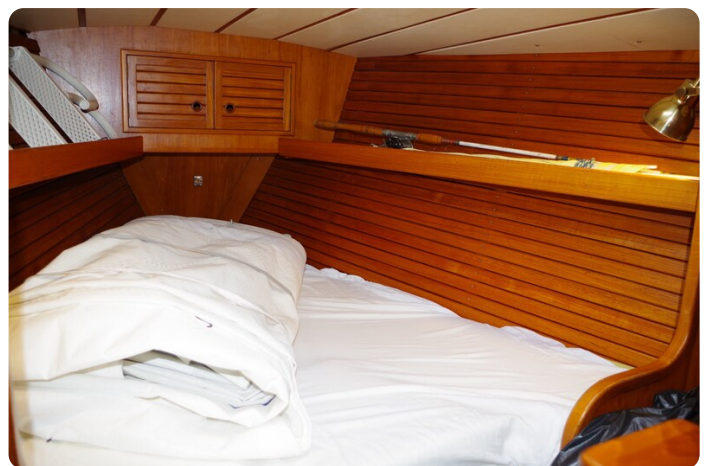
Avance 40 msp636285 8