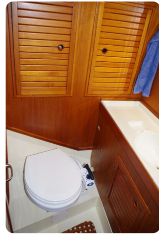
Avance 40 msp636285 10