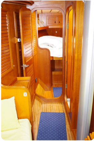
Avance 40 msp636285 11