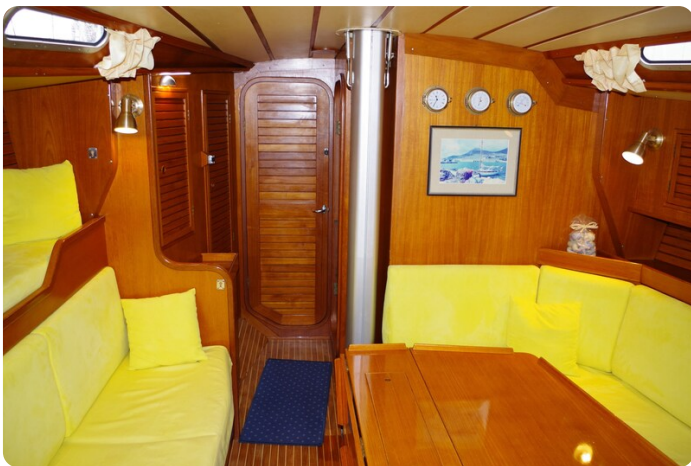
Avance 40 msp636285 13