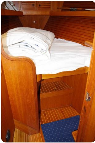
Avance 40 msp636285 9