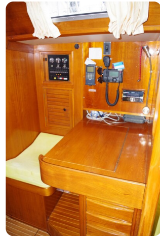
Avance 40 msp636285 16