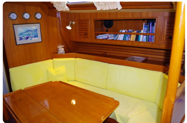
Avance 40 msp636285 14