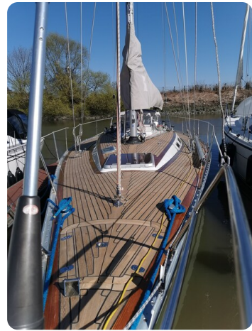
Avance 40 msp636285 4