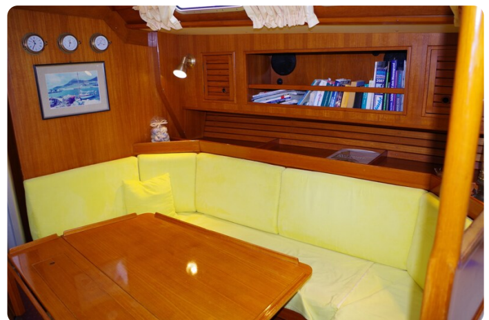
Avance 40 msp636285 14