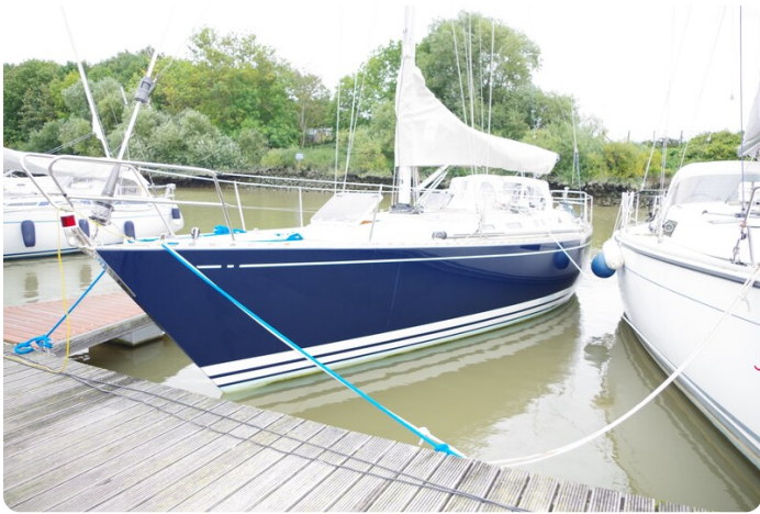
Avance 40 msp636285 3