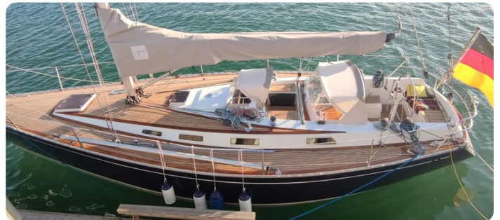
Avance 40 msp636285 1