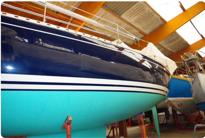
Avance 40 msp636285 23