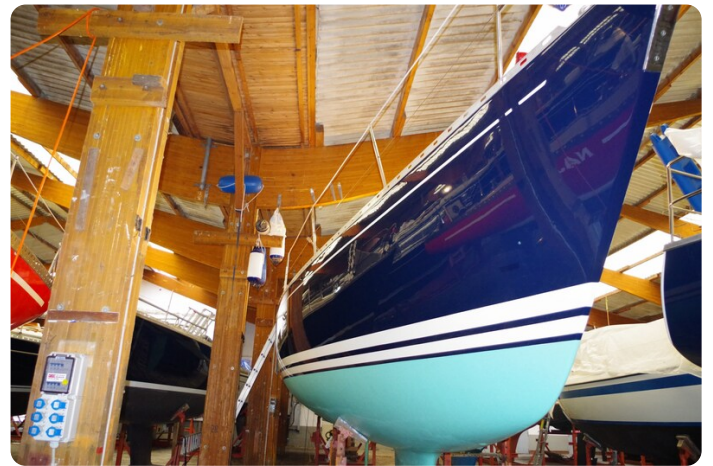
Avance 40 msp636285 24