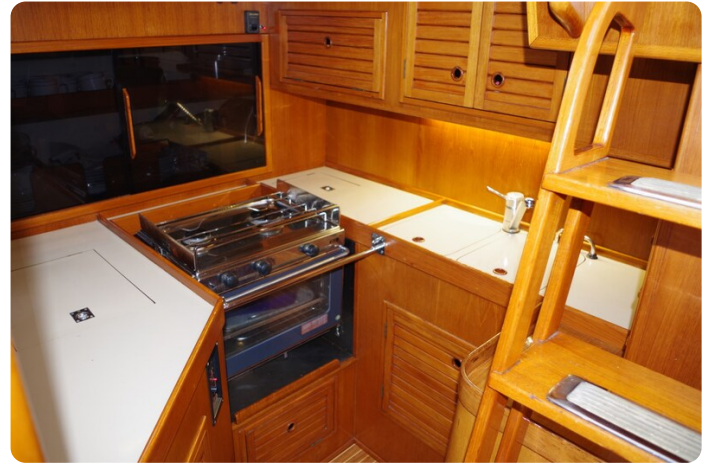
Avance 40 msp636285 18