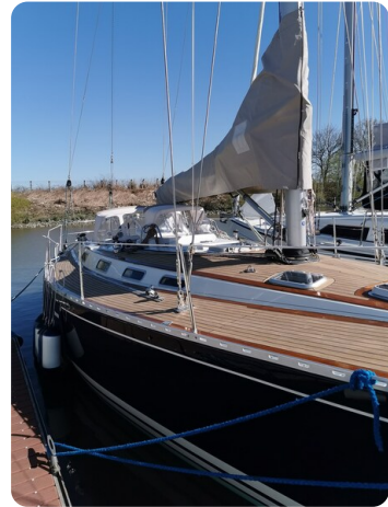
Avance 40 msp636285 6