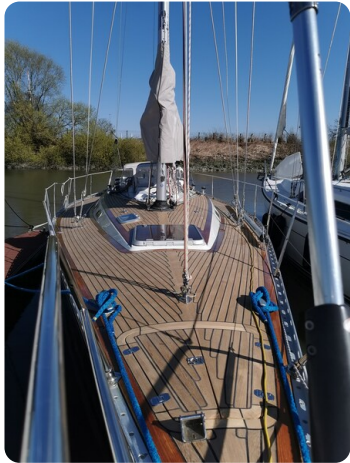
Avance 40 msp636285 5